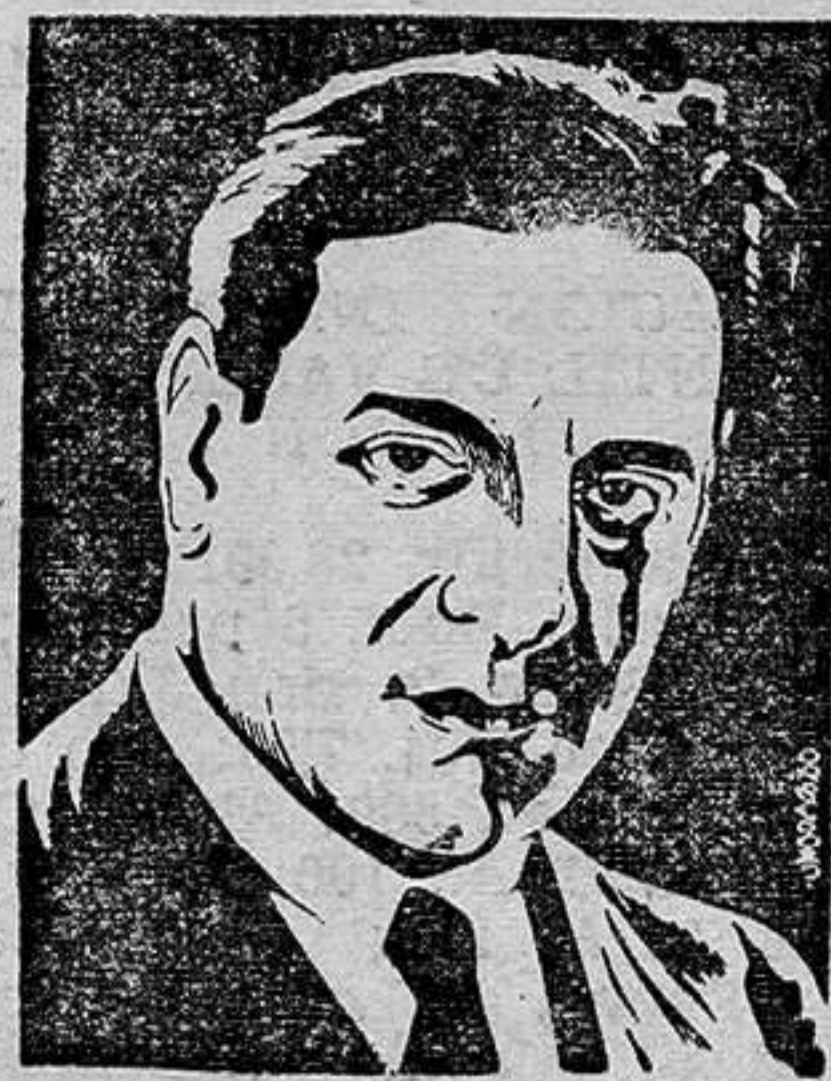
TITO SCHIPA Precios de costumbre.

TRES CABALLEROS DE FRAC Creación como actor y cantante del famoso tenor de fama mundial