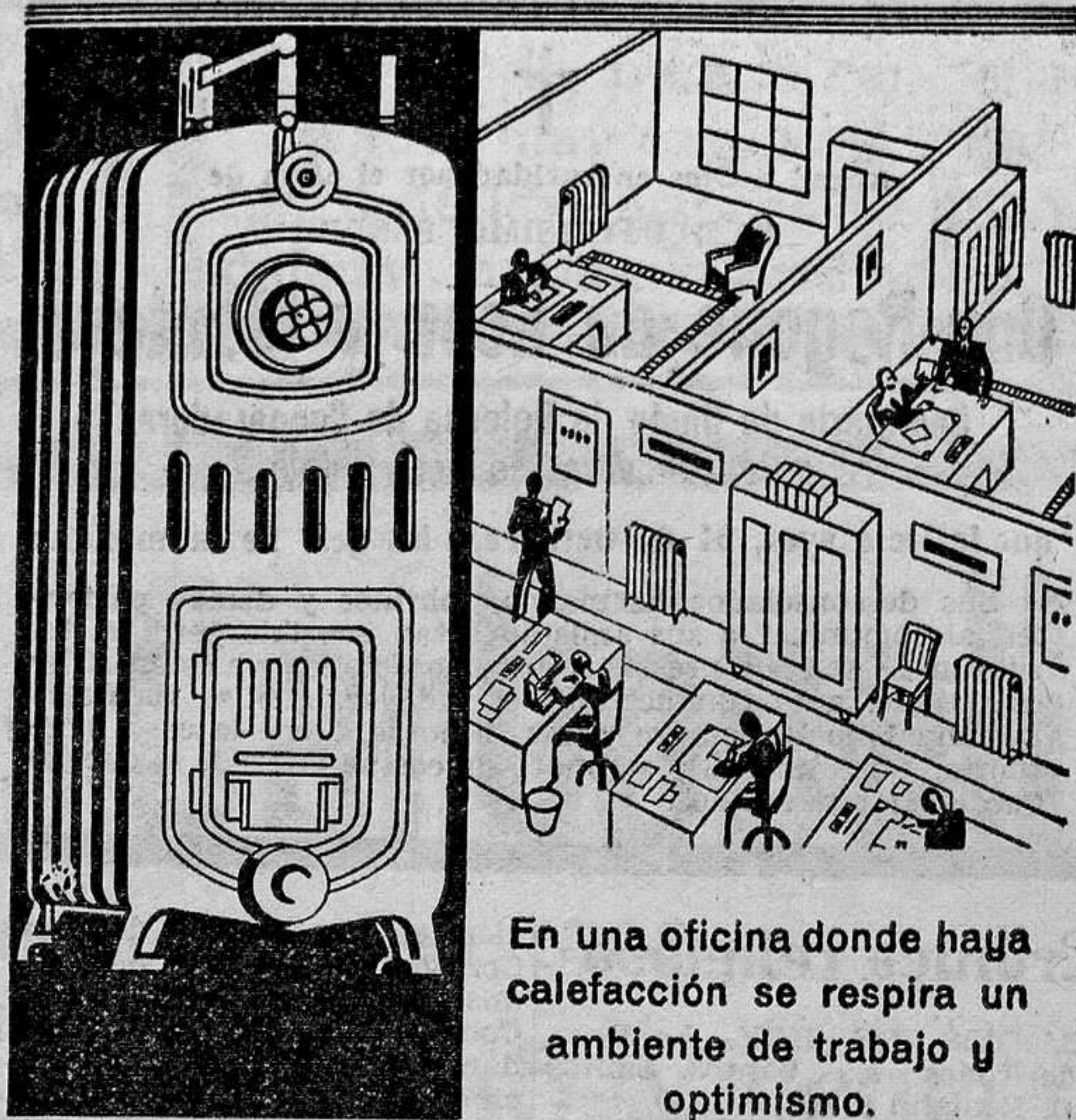
En una oficina donde haya calefacción se respira un ambiente de trabajo y optimismo.