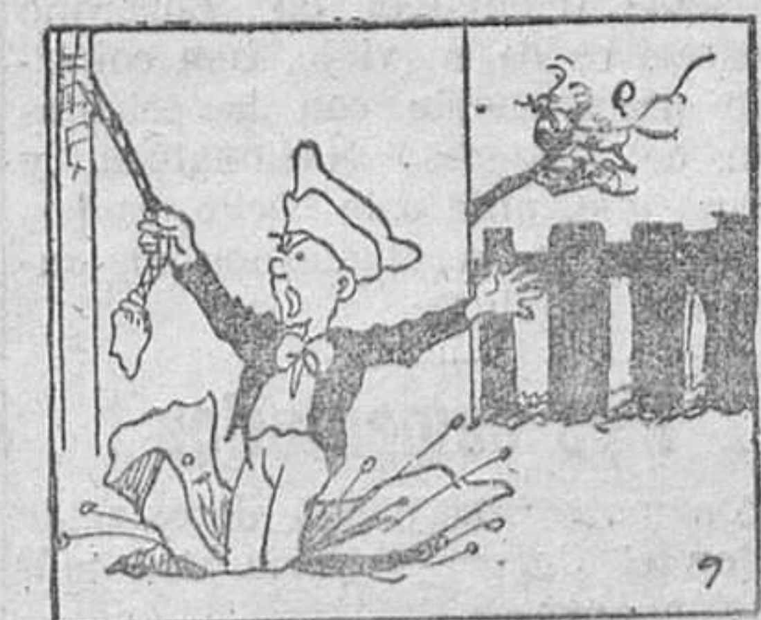
9. que, como no podía ser menos, cayó en la trampa.