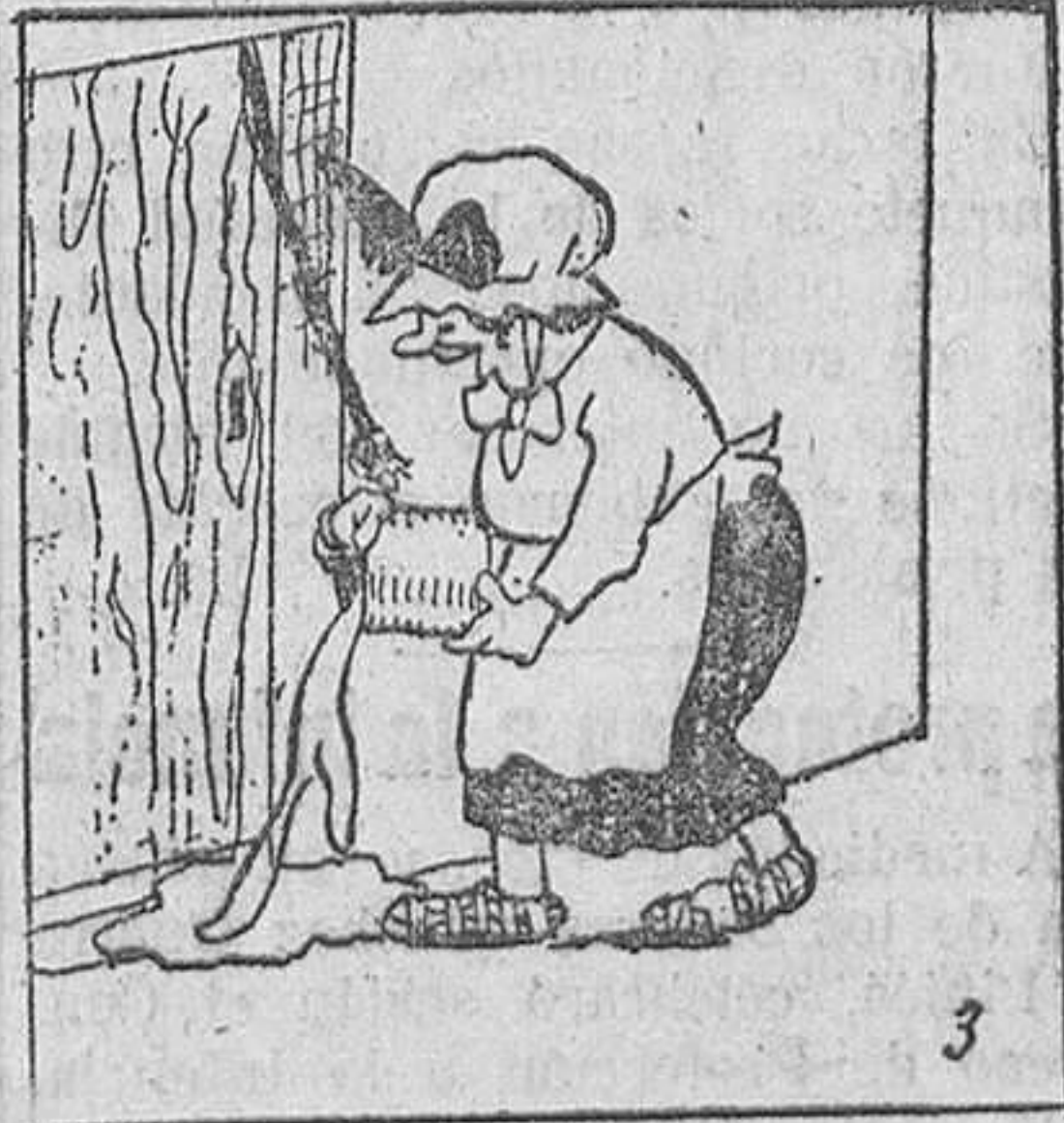
3. Una de las personas ya escamadas por la broma, era doña Escolástica, que un día mojó de pez la acera de su casa,