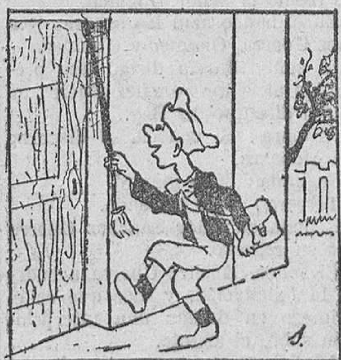
1. Periquín tenía la fea costumbre de llamar en todas las puertas que hallaba al paso,