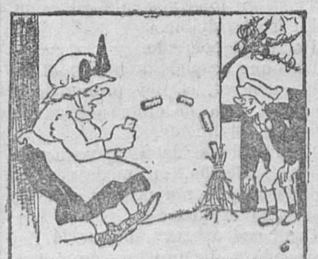
6. a perseguirle doña Escolástica, se viera desarmada, como así sucedió, con gran regocijo del rapaz.