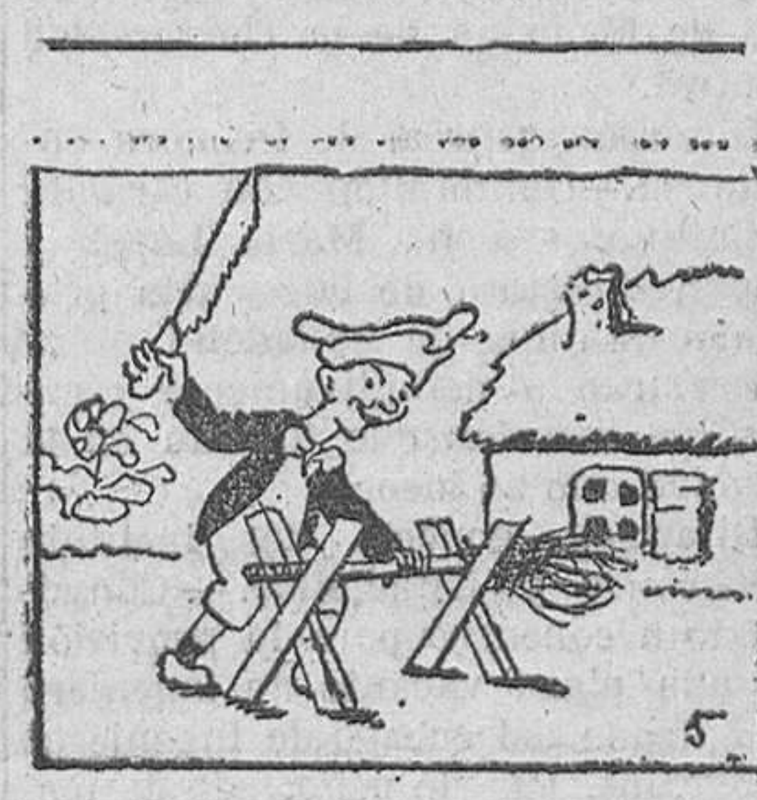
5. Pero lejos de enmendarse, aserró el palo de la escoba, para que al volver