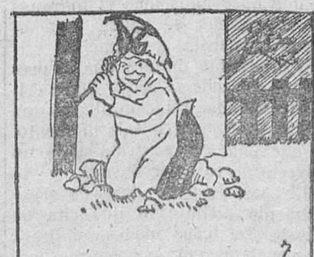
7. Mas doña Escolástica no era mujer que se dejaba vencer con facilidad, y así hizo un hoyo,