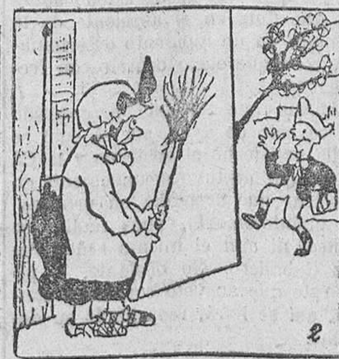
2. burlándose luego de quienes salían a conocer al autor de la gracia.