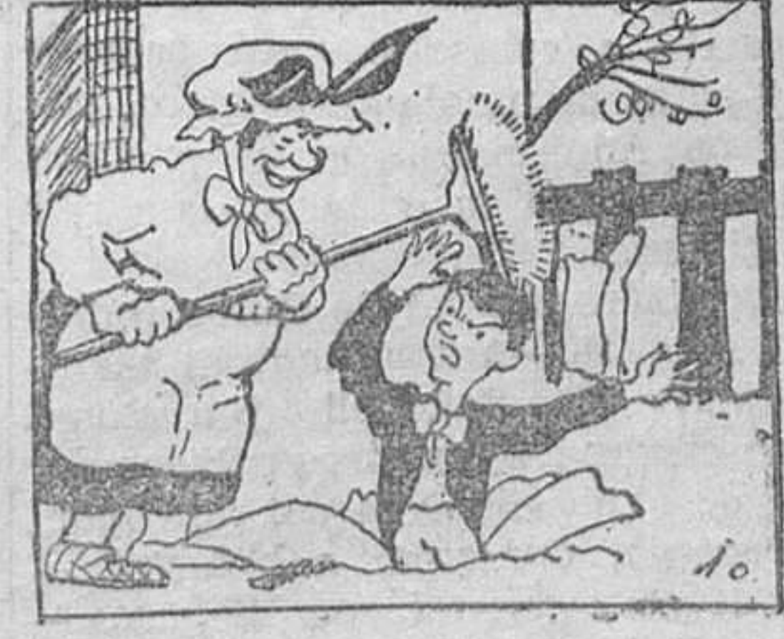
10. Recibiendo en pago de su recalcitrante manía, una paliza que le quitó para siempre las ganas de reincidir.