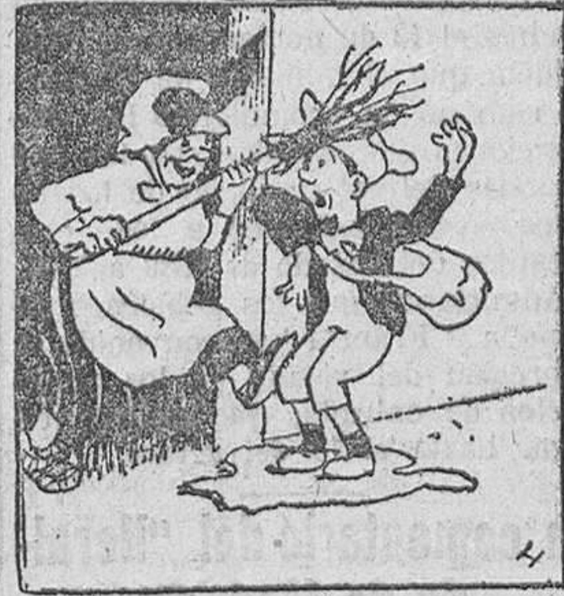
4. en la cual quedó preso ese travieso Perico, que recibió su merecido.