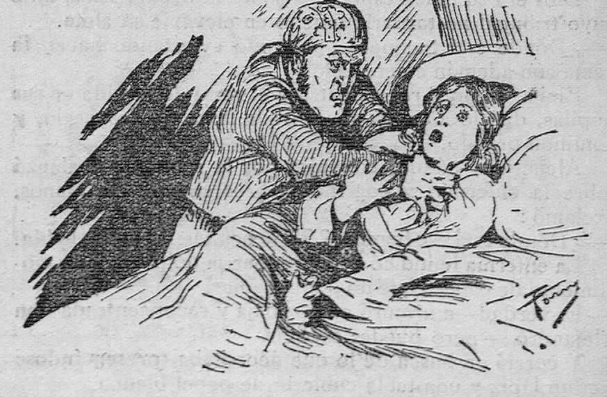
Y así como la hiena hambrienta se arroja sobre la presa.

Alejandro apartó sus ojos del Hijo de María como temiendo que le reconviniera.