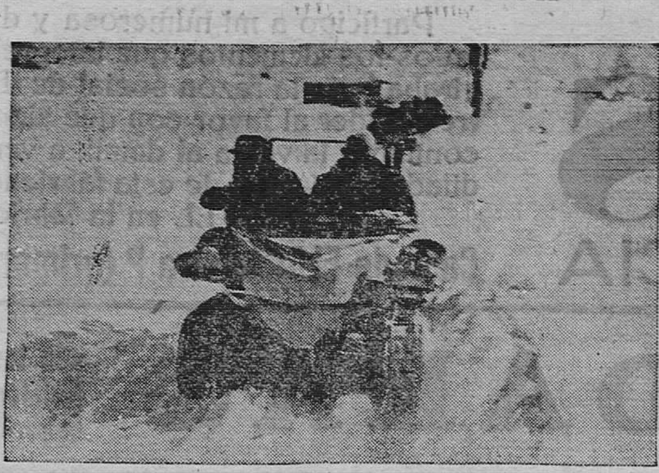
En los Alpes se está empleando con eficacia para viajar sobre la nieve el automóvil-orugu

Con una solemnidad extraordinaria se celebró el domingo pasado en el «Lo Rat-Perat» la fiesta del reparto de premios a los niños que tomaron parte en este concurso. Cinco lindas señoritas ataviadas con el traje típico regional, dieron la nota simpática de la fiesta, así como dos labradores vestidos a la antigua usanza, y todos ellos artísticamente colocados en el estrado, daban un buen golpe de vista.