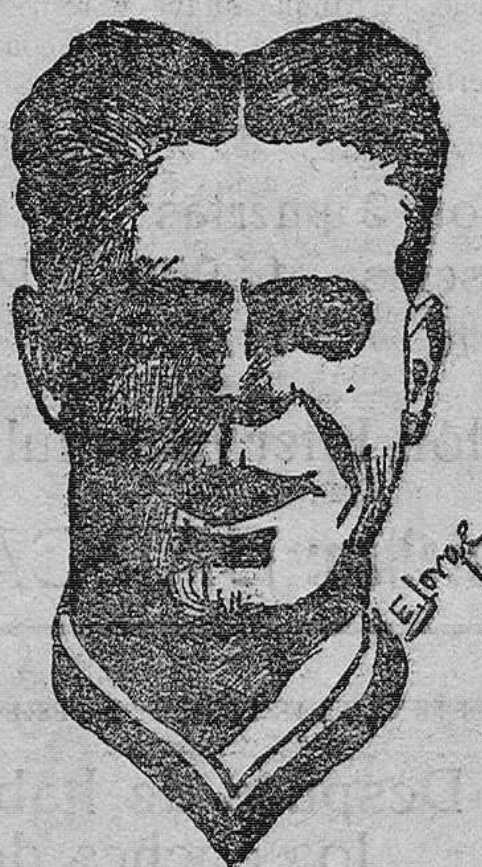
Zamora, el héroe de Bolonia