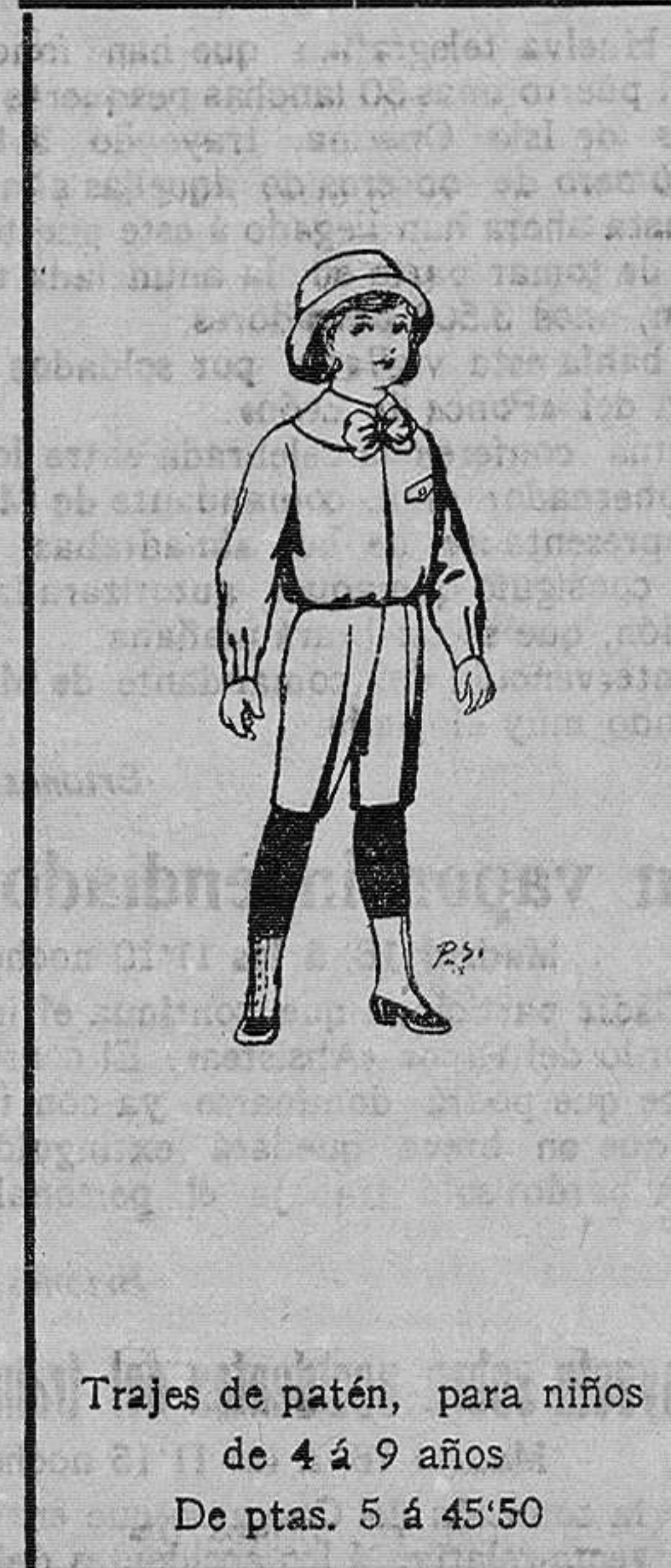
Trajes de patén, para niños de 4 á 9 años De ptas. 5 á 45/50