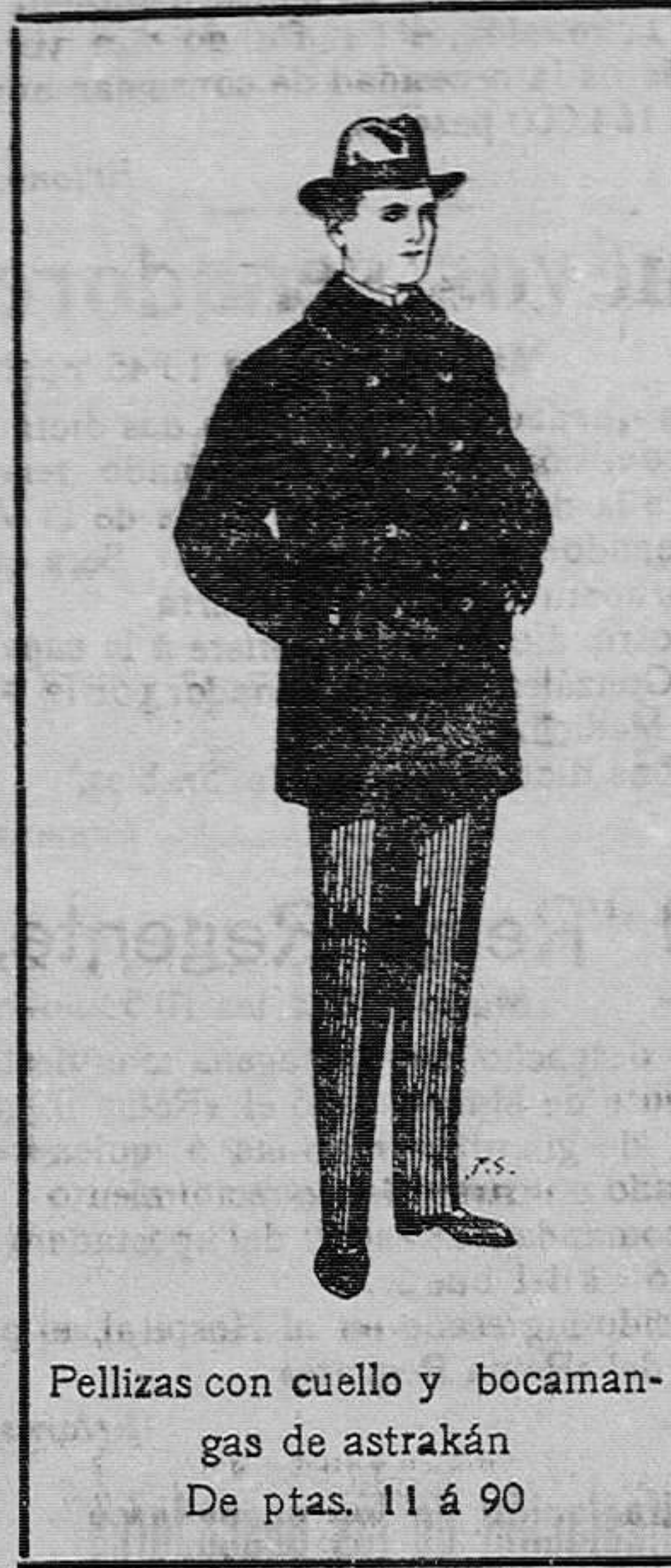
Pellicias con cuello y bocanagas de astracán De ptas. 11 á 90