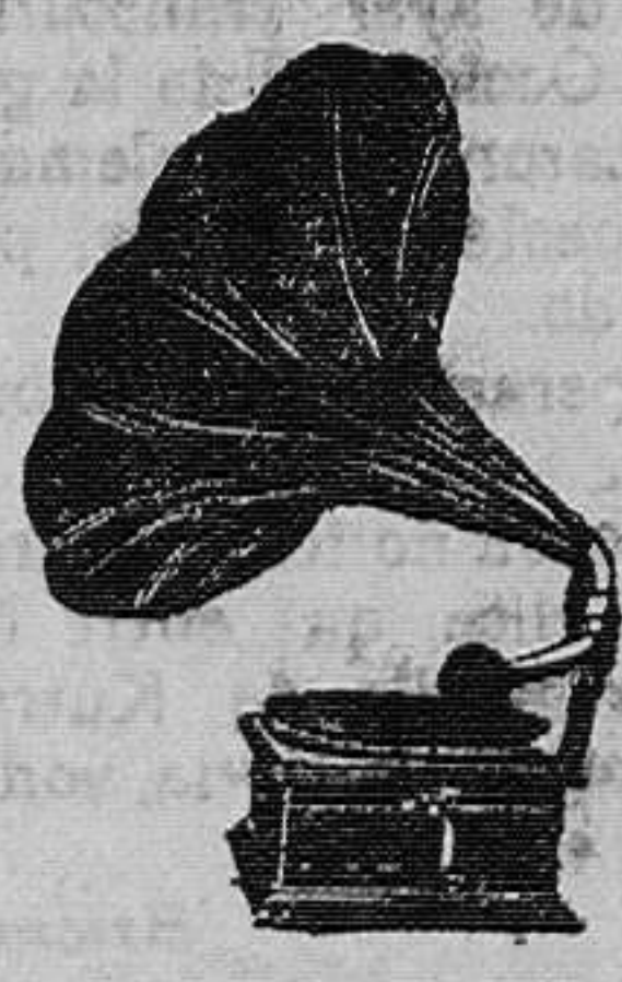
GRAMOFONOS desde 60 pesetas en adelante, de las mejores marcas conocidas hasta la fecha. Discos.