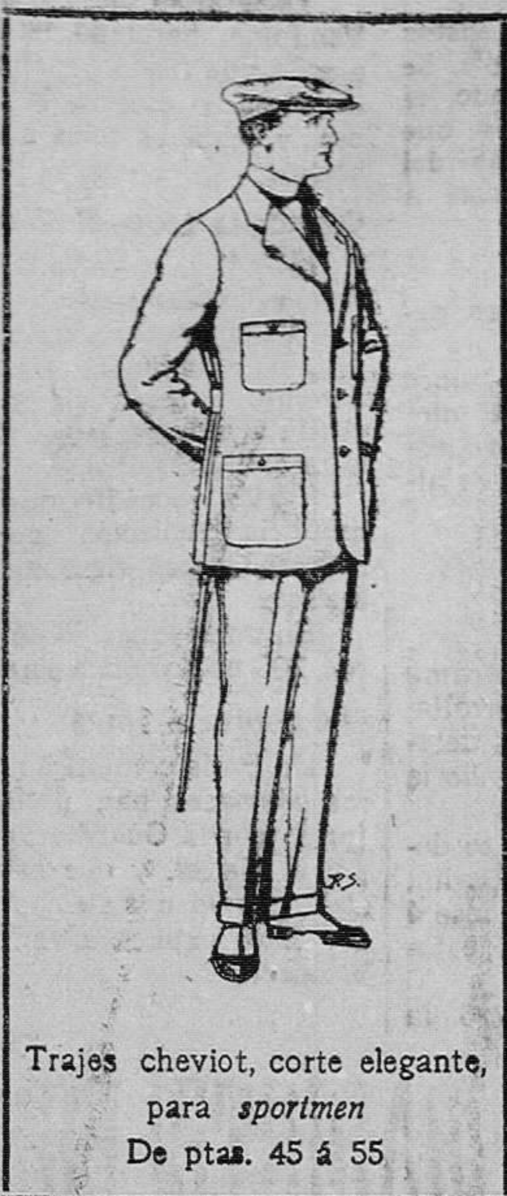
Trajes cheviot, corte elegante, para sportmen De ptas. 45 á 55