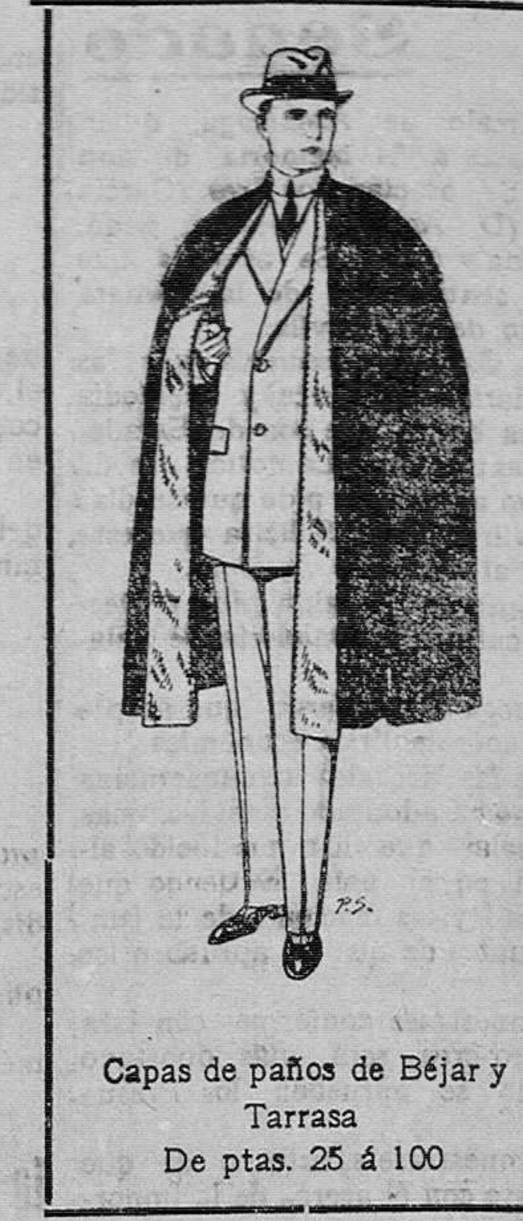
Capas de paños de Béjar y Tarrasa De ptas. 25 á 100