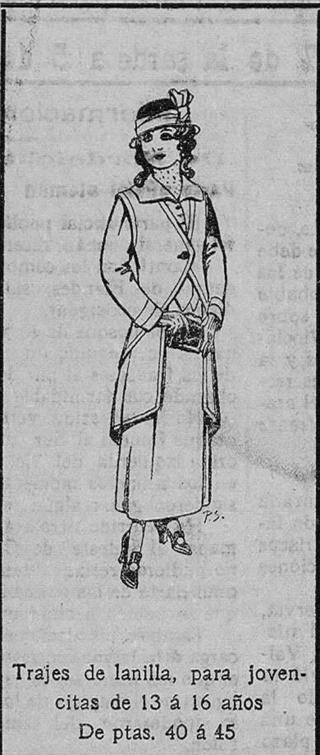
Trajes de lanilla, para jovencitas de 13 á 16 años De ptas. 40 á 45