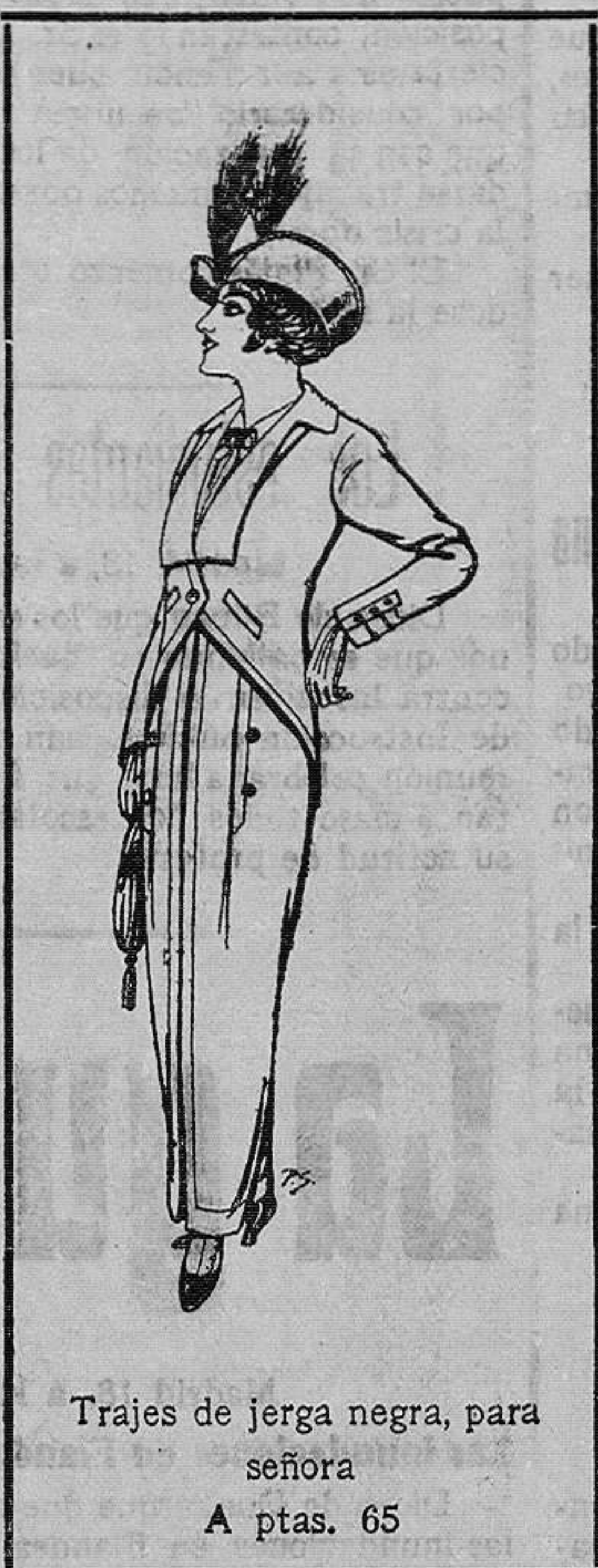
Trajes de jerga negra, para señora A ptas. 65

Peletería, Camisería, Géneros de punto, Corbatería, Guantería, Sombrerería, Zapatería, Paraguas, Bastones, y Artículos de viaje.