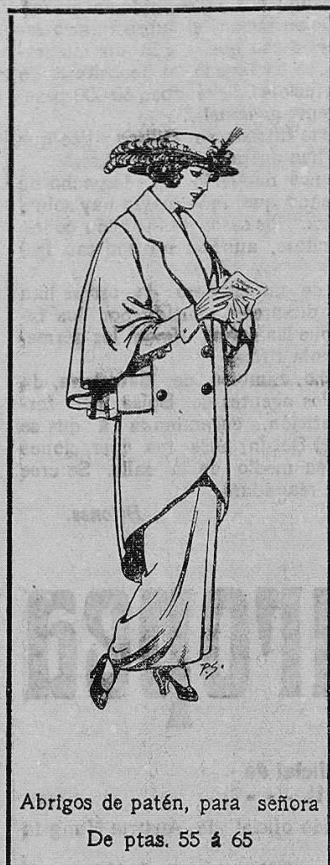
Abrigos de patén, para señora De ptas. 55 á 65