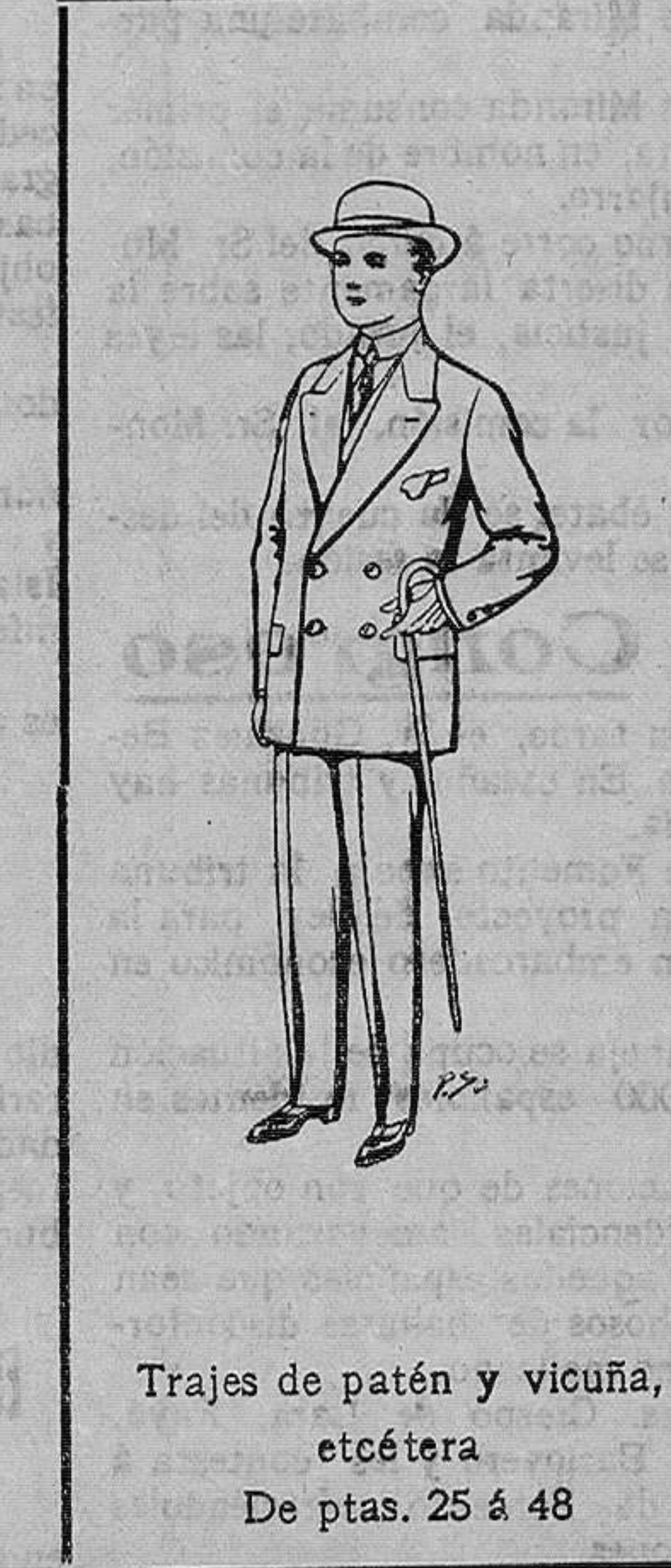
Trajes de patén y vicuña, etcétera De ptas. 25 á 48