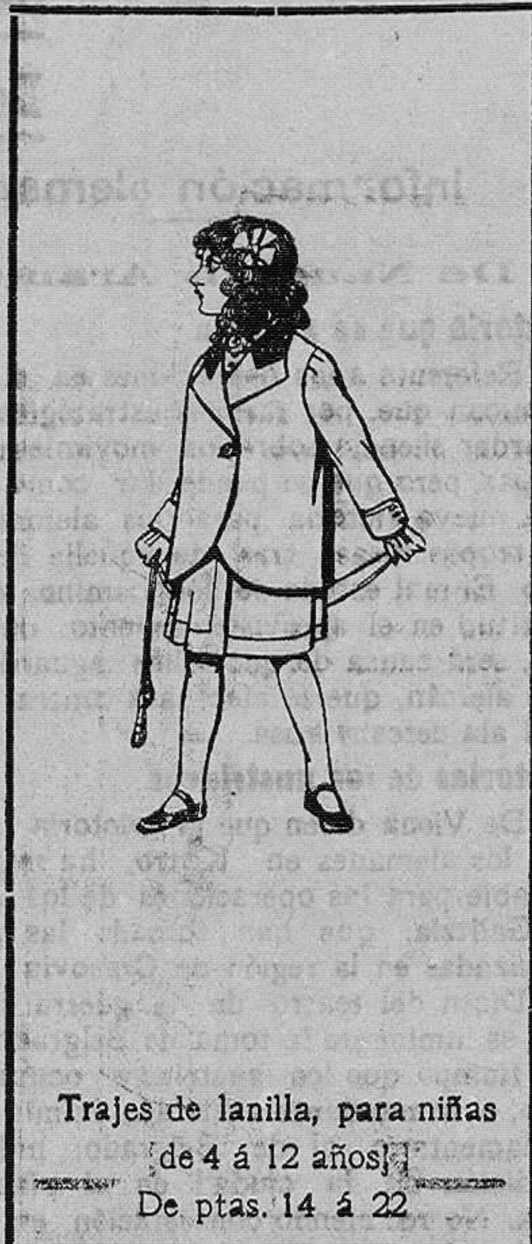
Trajes de lanilla, para niñas de 4 á 12 años De ptas. 14 á 22