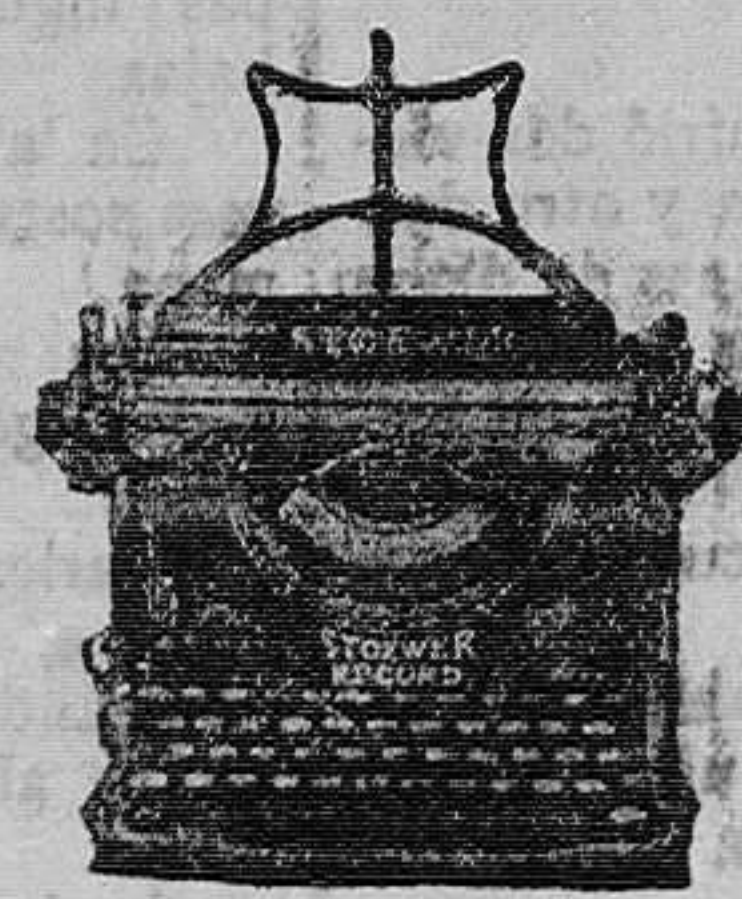
Stower Record Escritura visible, magnífica y perfectamente alineada, con cambios de rapidez.