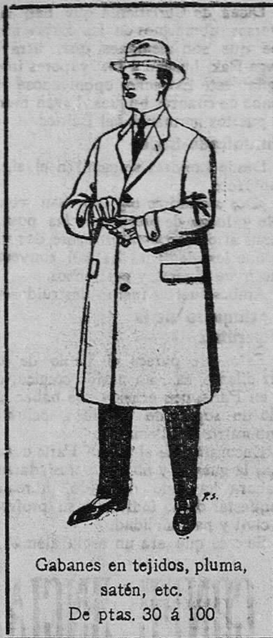
Gabanes en tejidos, pluma, satén, etc. De ptas. 30 á 100