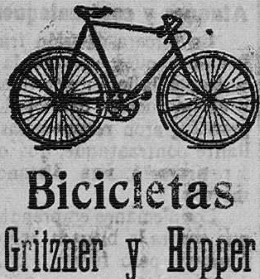
Bicicletas Gritzer y Hopper Motocicletas con coche lateral, 4 H. P. PESETAS 1.900