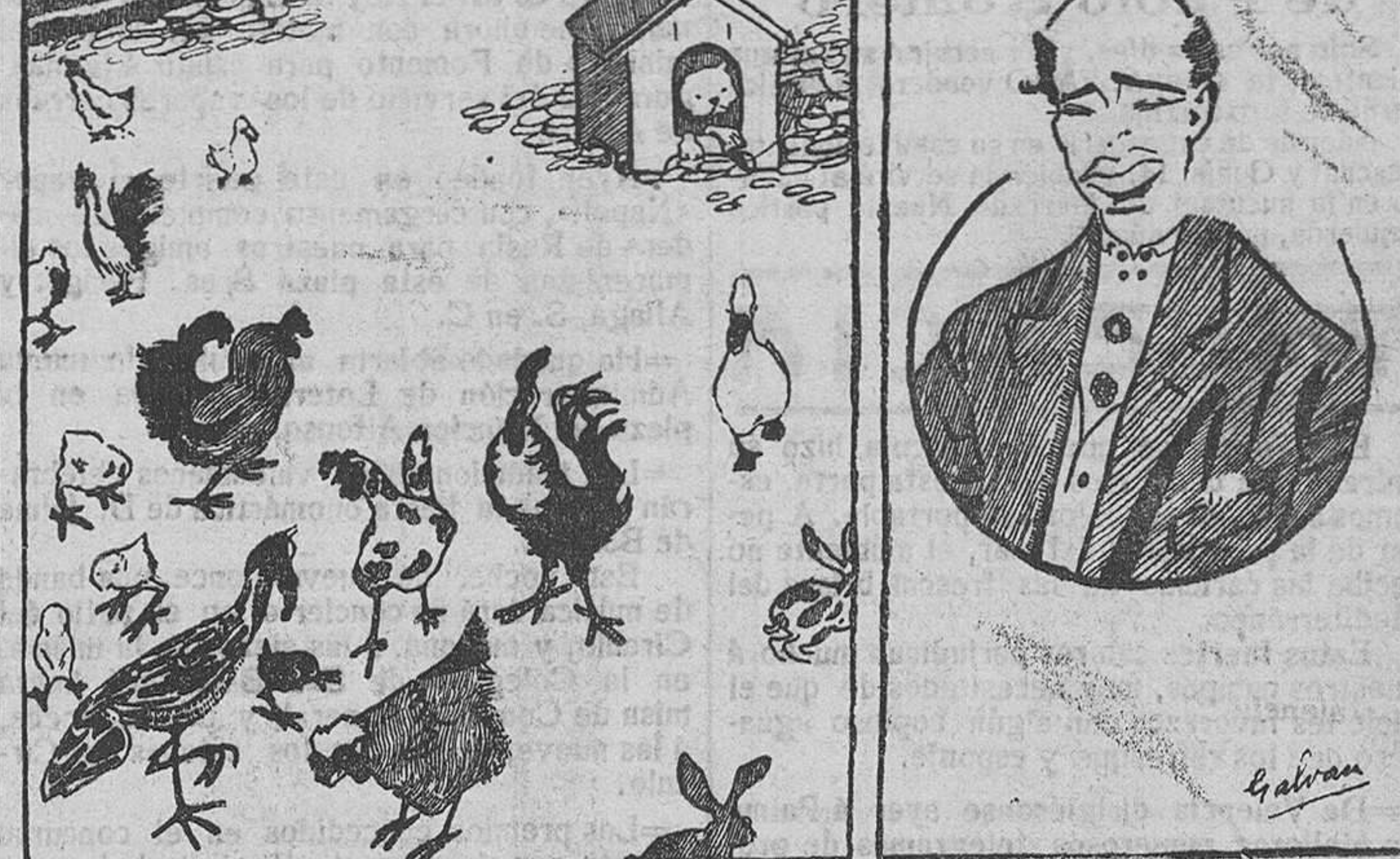
En pleno «kikiriquí» estamos hoy en Valencia: «Gallos» en la plaza de Toros demostrando su guapeza; «Chantecler» en la Gran Pista

Marina, actuando de madrasas distinguidas damas de la aristocracia, cuyos nombres aún no están definitivamente designados.