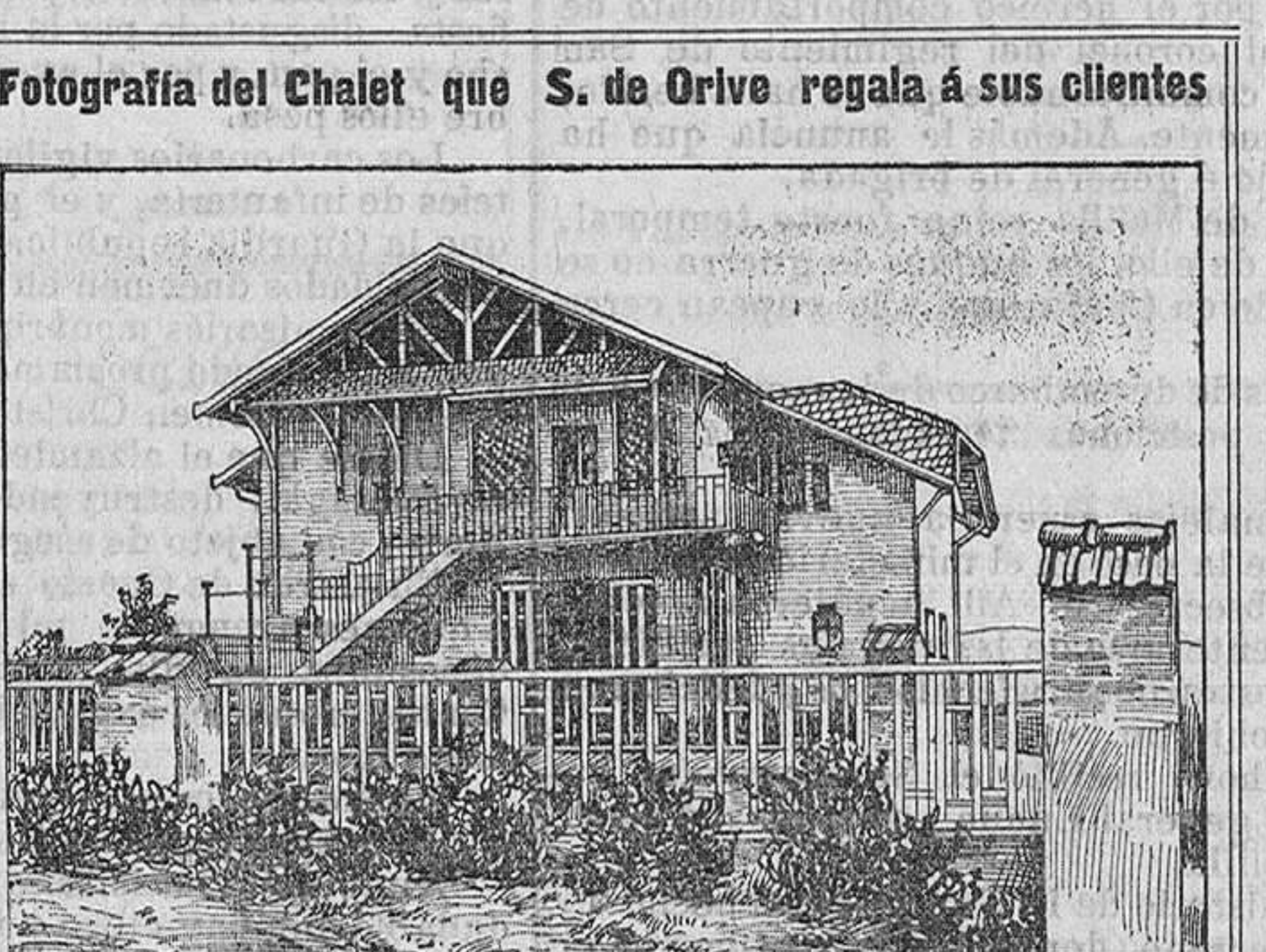
Fotografía del Chalet que S. de Orive regala a sus clientes

Navegación General Italiana Directo a Montevideo y Buenos Aires TRAVESIA EN 16 DIAS SARDEGNA Saldrá el día 27 de octubre, admitiendo CARGA y pasaje de 1ª, 2ª y 3ª clase.—Servicio de cocina a la española.