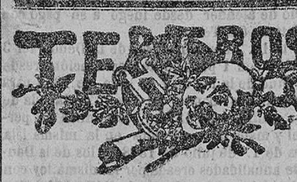
TEMEROS. Esta noche se celebrará la tercera función de moda en este favorecido teatro...