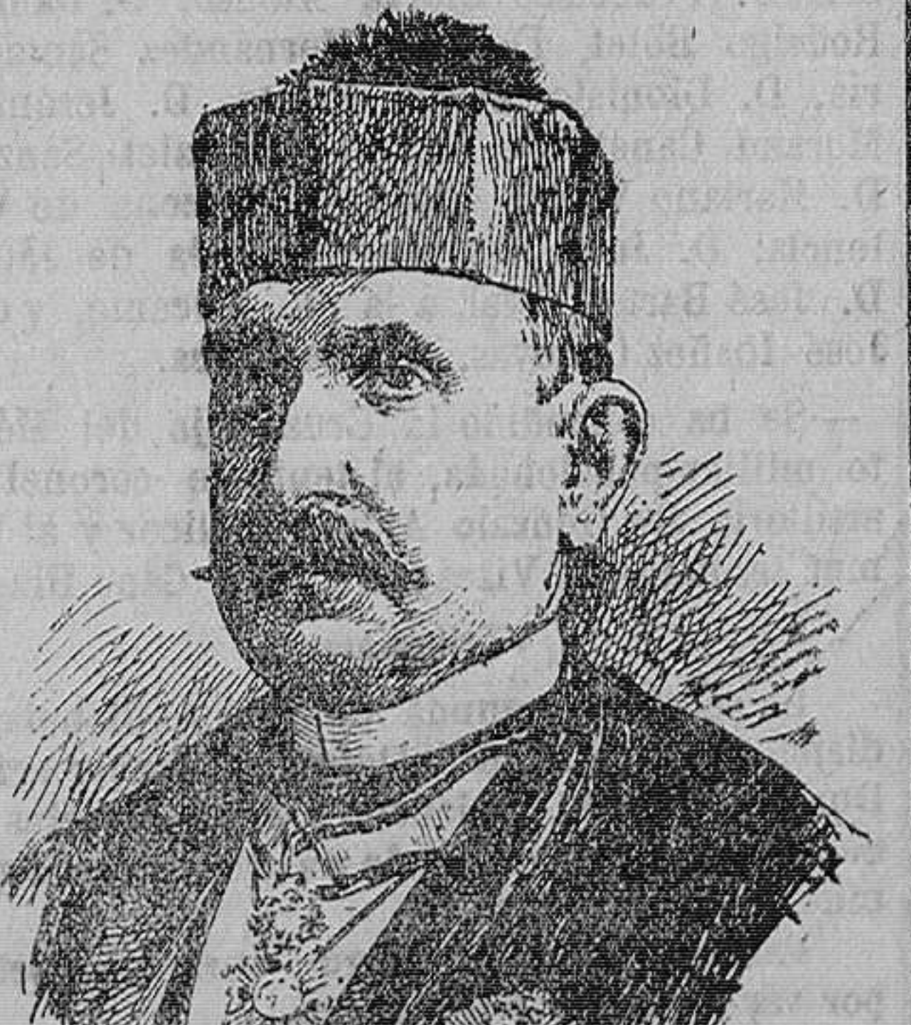
D. PASCUAL DOMENECH Director de Establecimientos penales

«Las gravísimas circunstancias — continúa — por que atraviesa España reclamaban más energía en el ministro. — El gobierno no ha cumplido nada de lo que ofreció á las Cámaras de Comercio y estas acordaron en la Asamblea de Zaragoza.