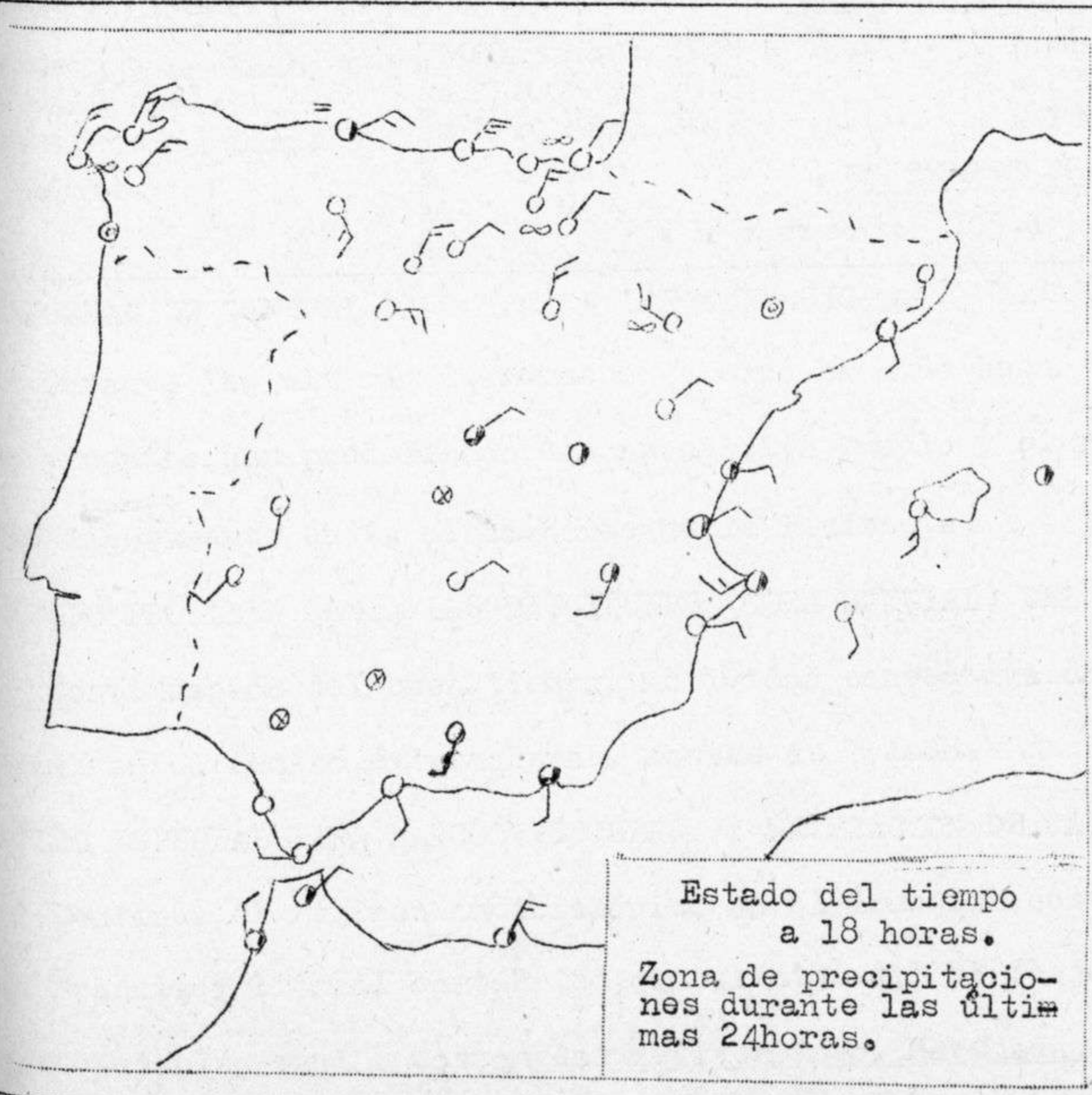
Estado del tiempo a 18 horas. Zona de precipitaciones durante las últimas 24 horas.