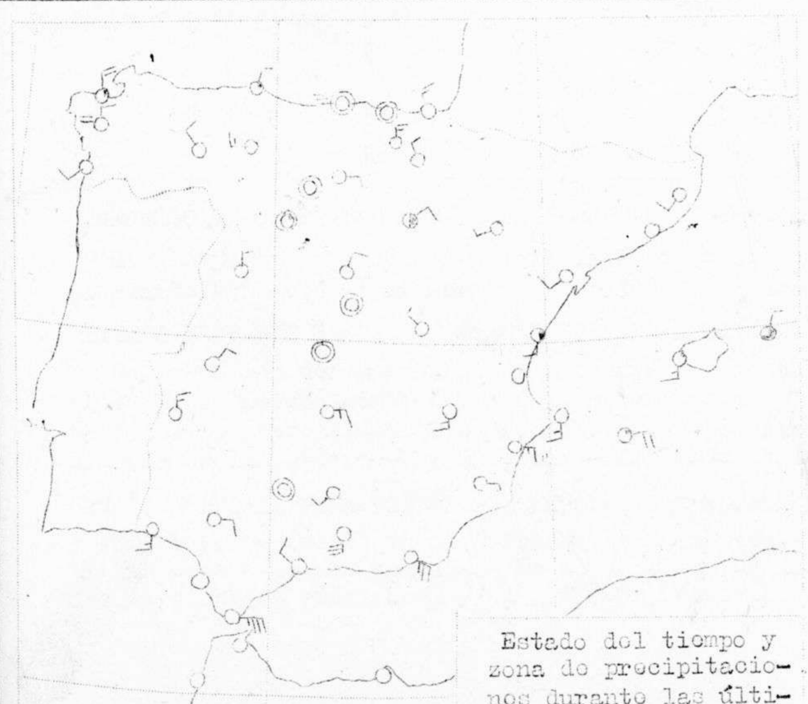
Estado del tiempo y zona de precipitaciones durante las últimas 24 horas.