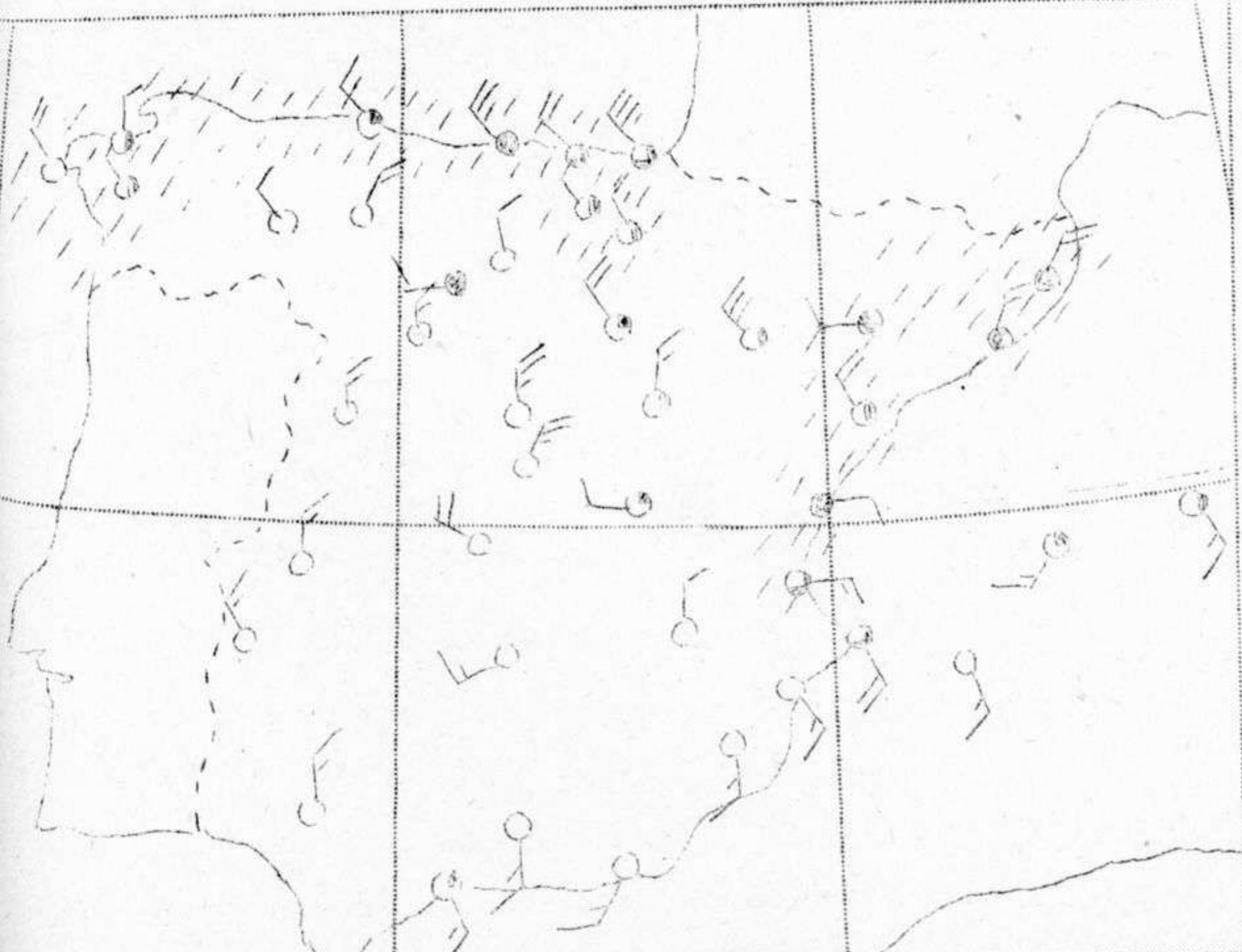
Estado del tiempo y zona de precipitación durante las últimas 24 horas.