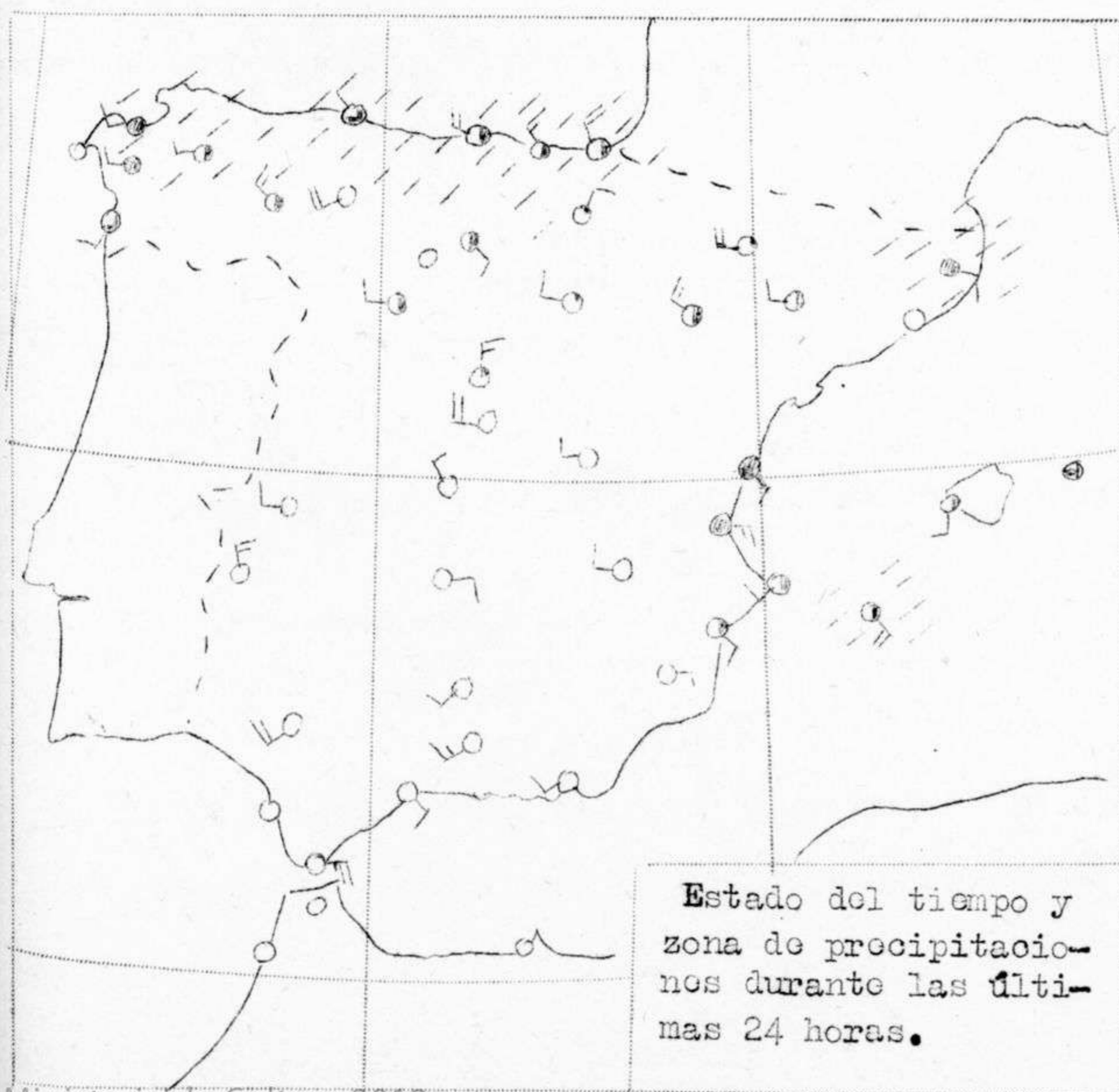
Estado del tiempo y zona de precipitaciones durante las últimas 24 horas.