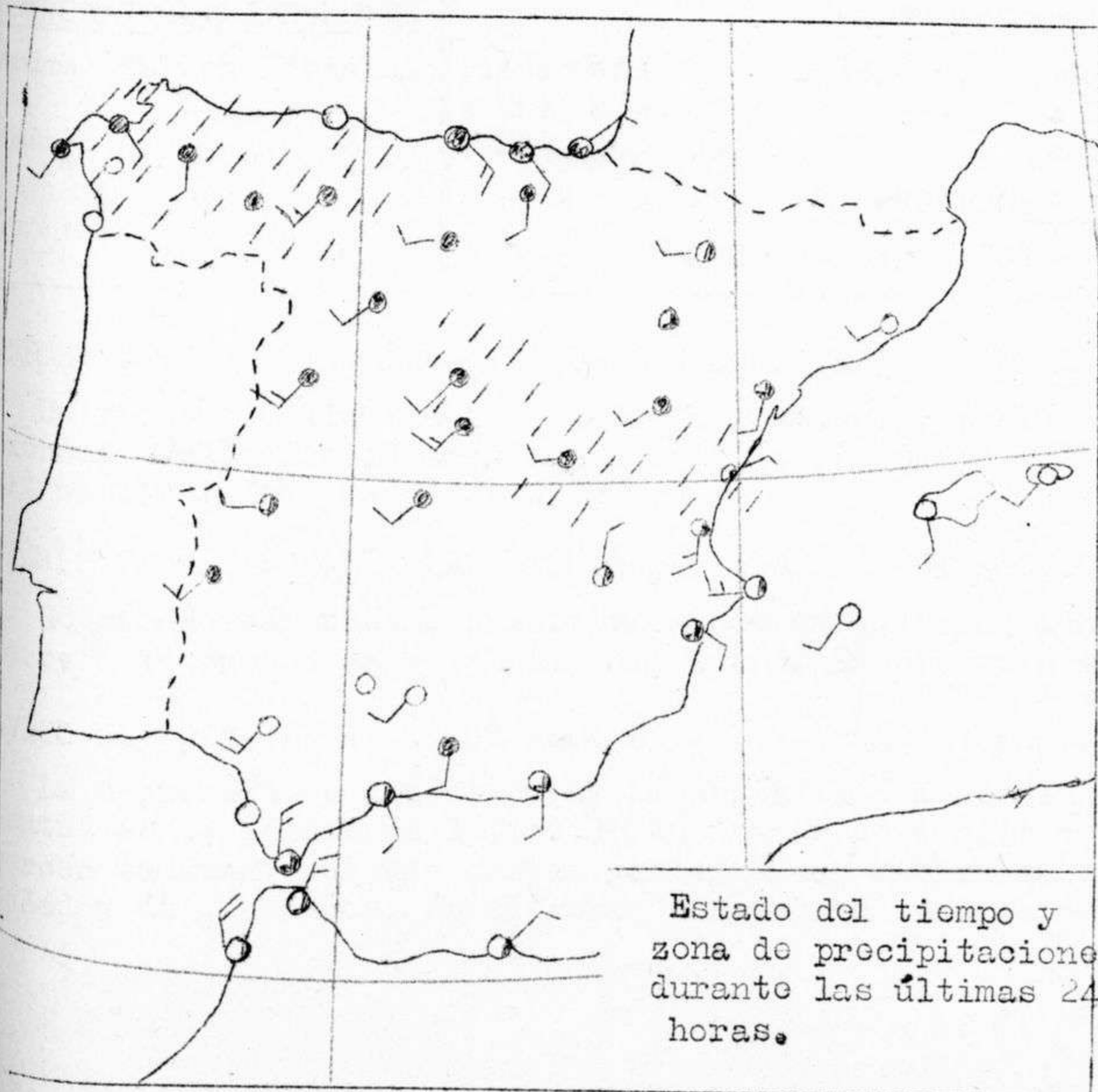
Estado del tiempo y zona de precipitaciones durante las últimas 24 horas.