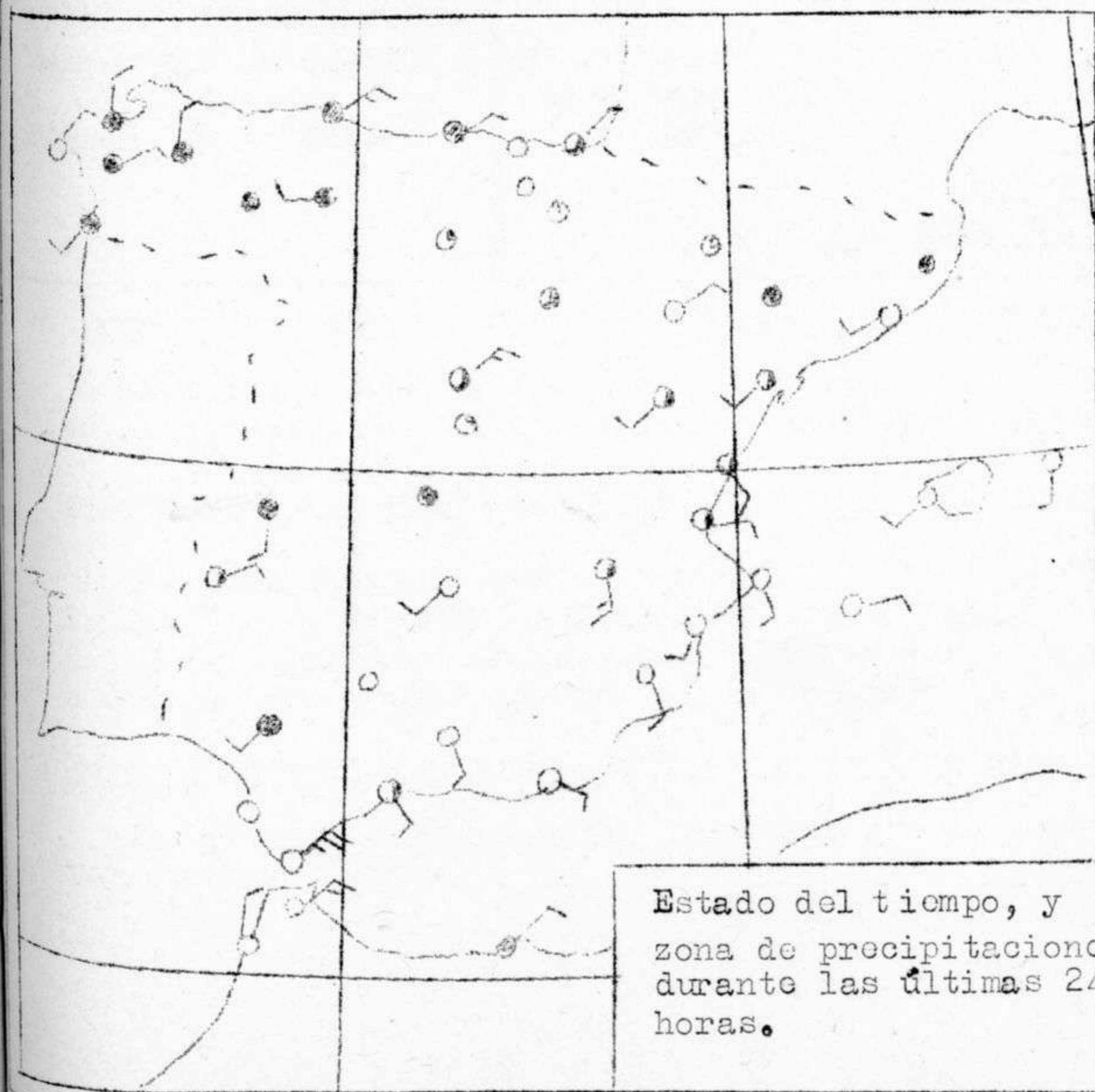
Estado del tiempo, y zona de precipitaciones durante las últimas 24 horas.