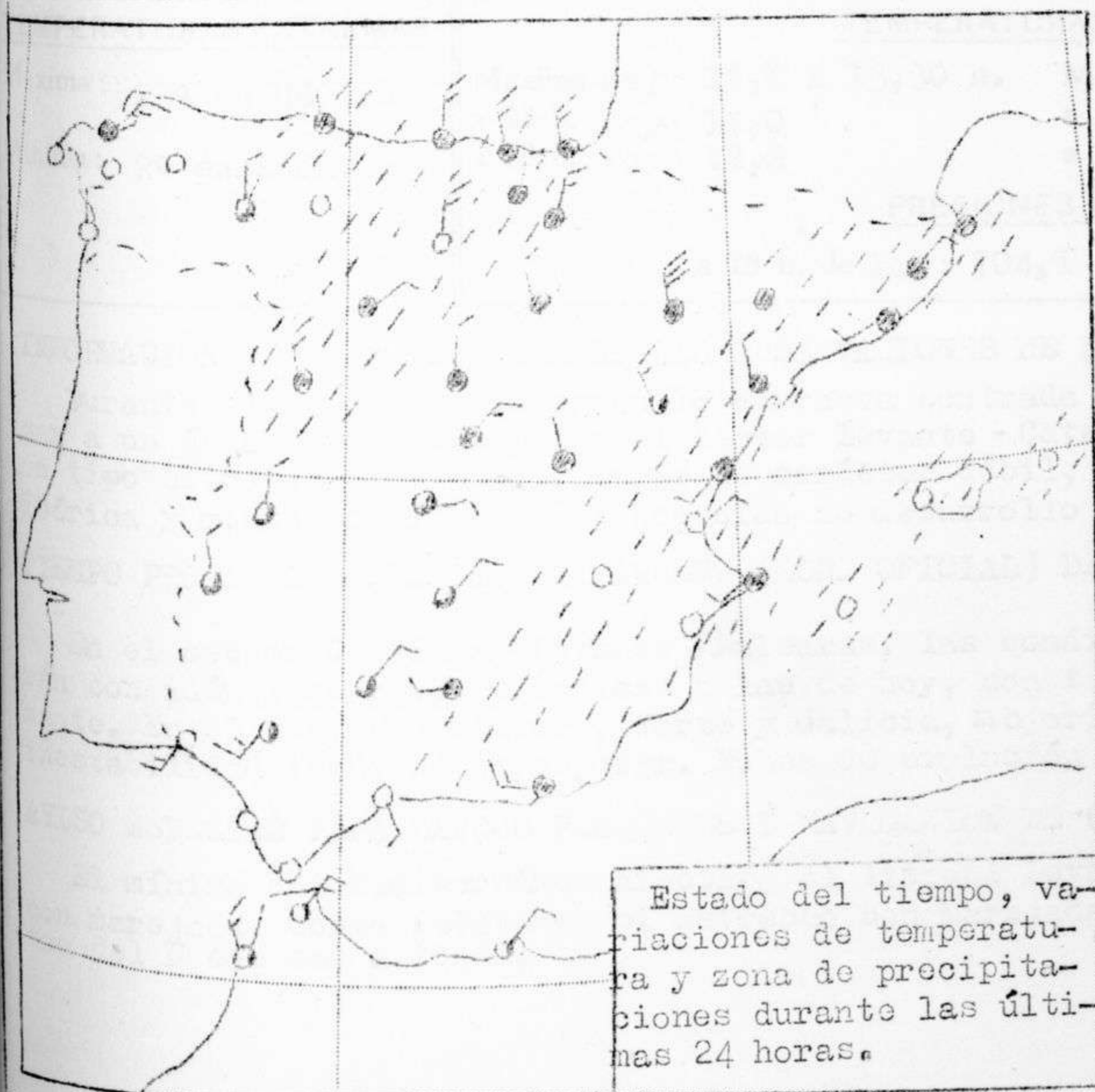
Estado del tiempo, variaciones de temperatura y zona de precipitaciones durante las últimas 24 horas.