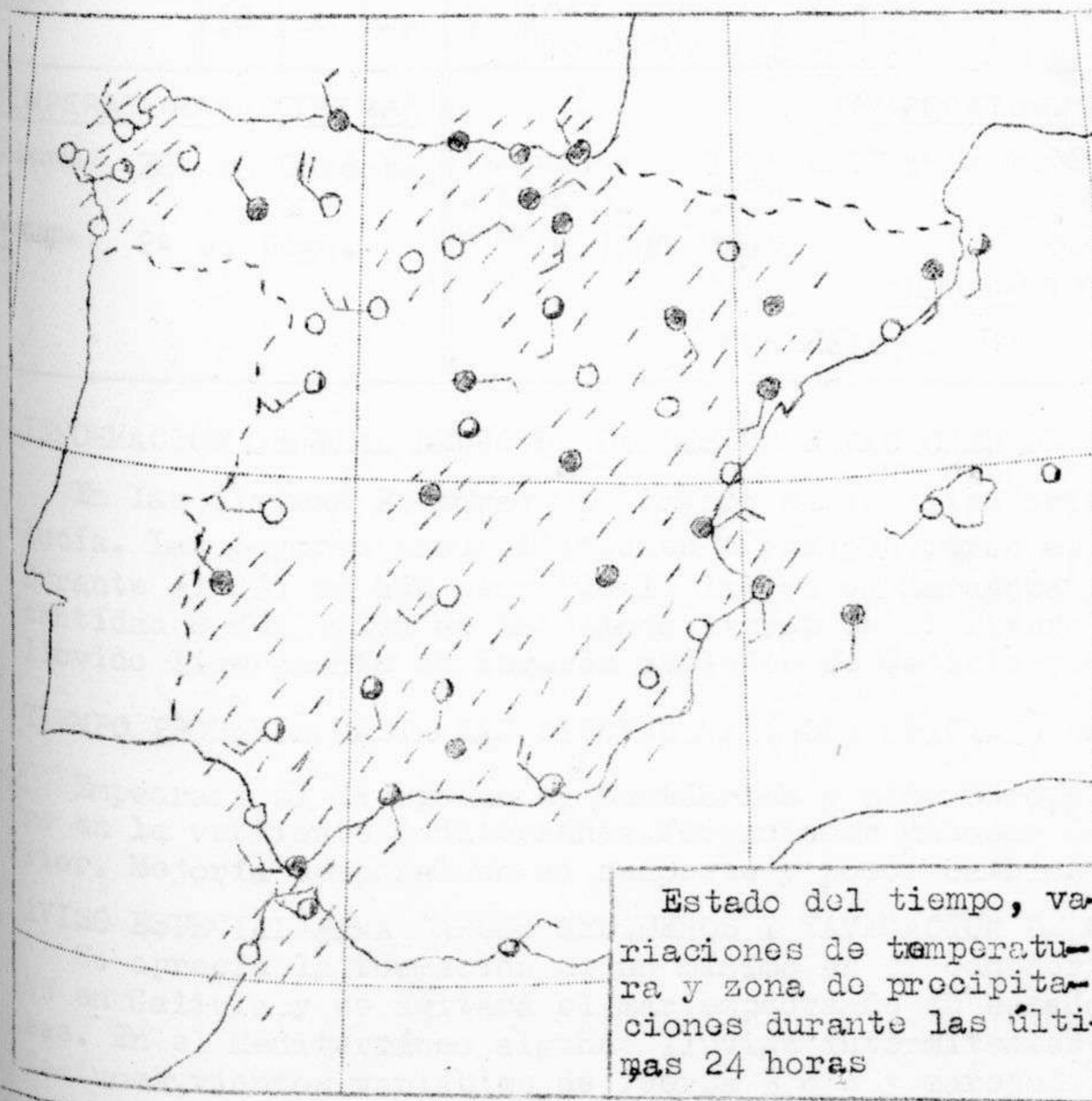
Estado del tiempo, variaciones de temperatura y zona de precipitaciones durante las últimas 24 horas