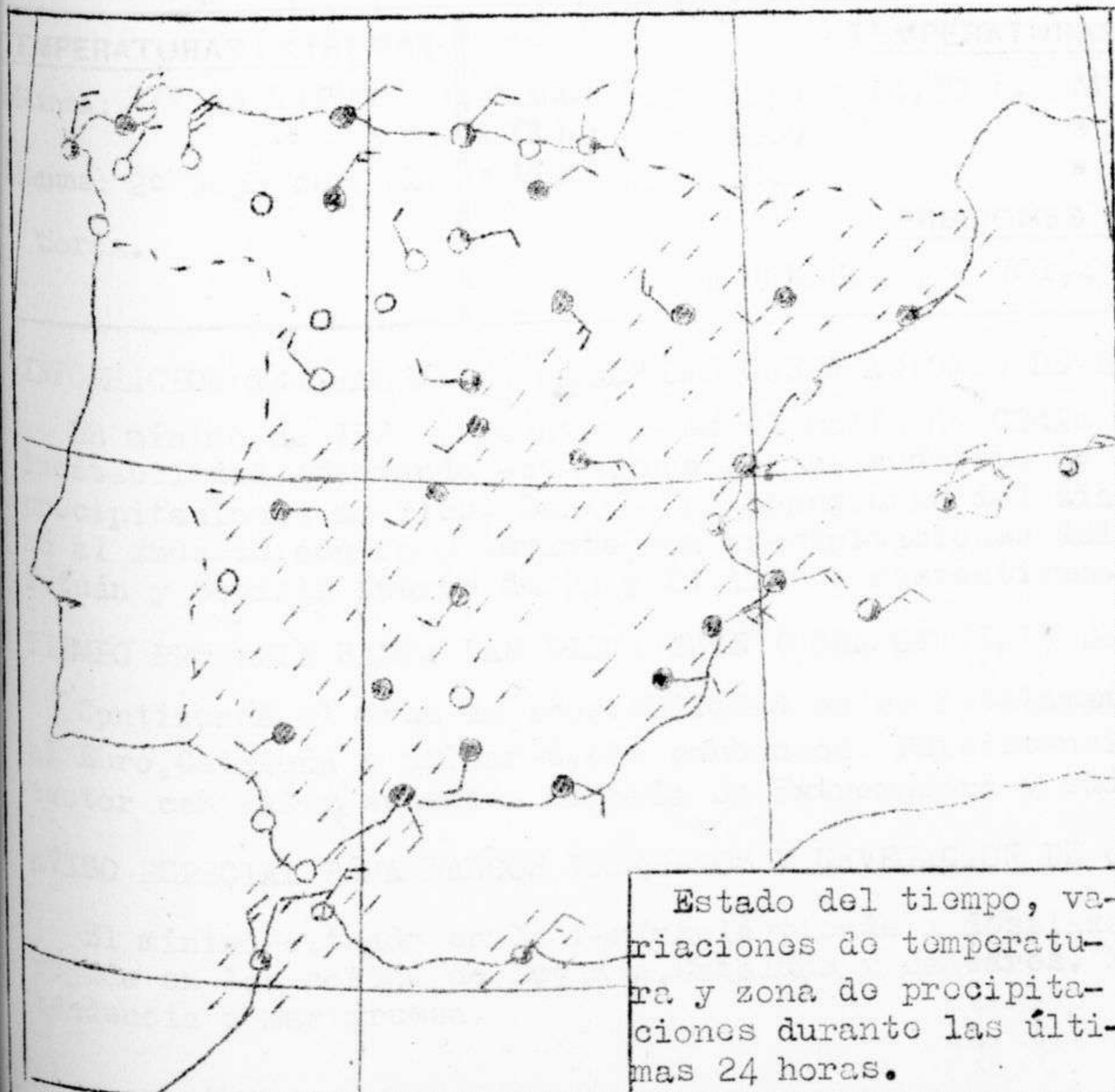
Estado del tiempo, variaciones de temperatura y zona de precipitaciones durante las últimas 24 horas.