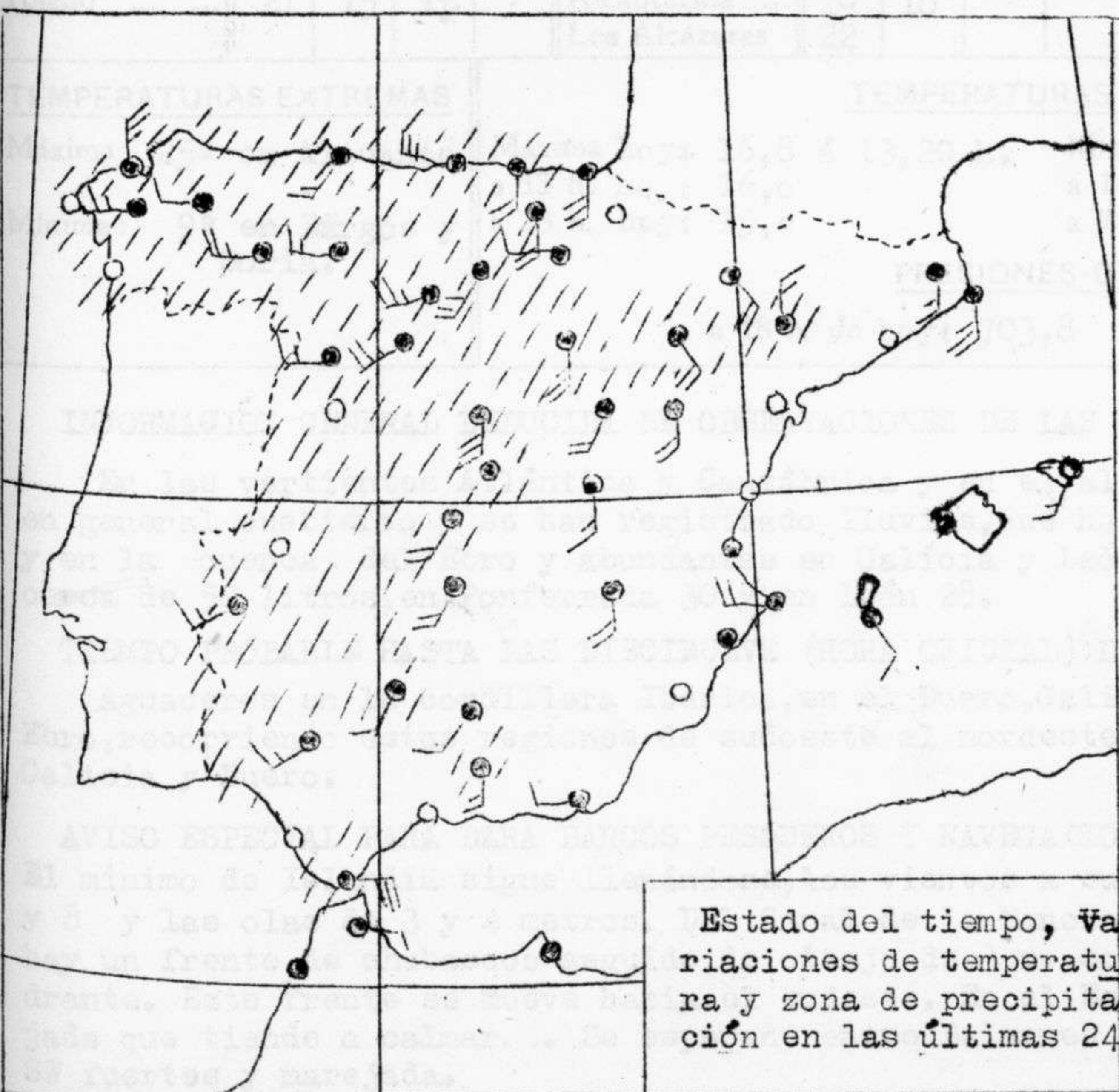
Estado del tiempo, Variaciones de temperatura y zona de precipitación en las últimas 24h.