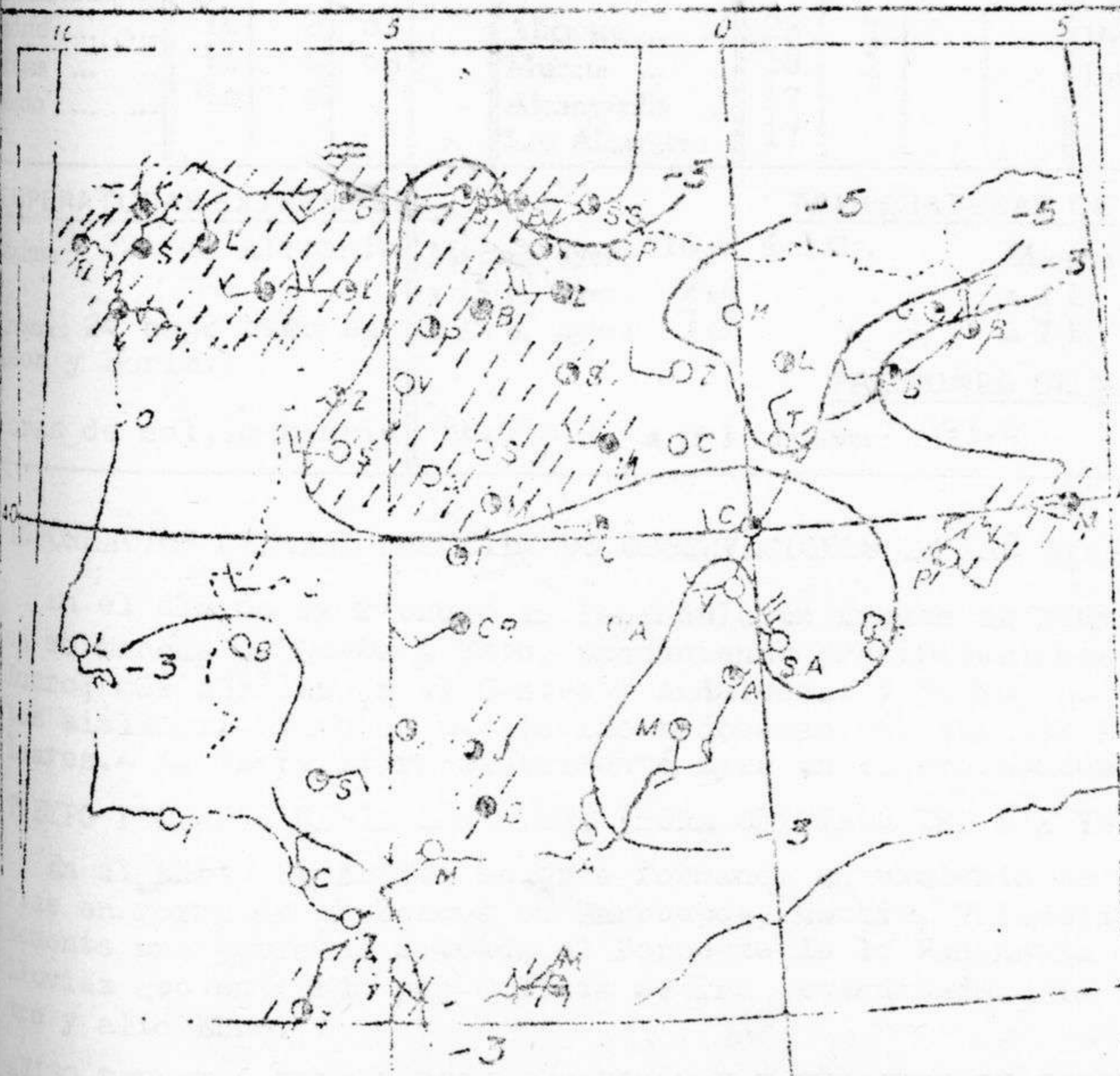
Estado del tiempo, variaciones de temperatura y zonas de precipitación en las últimas 24 horas