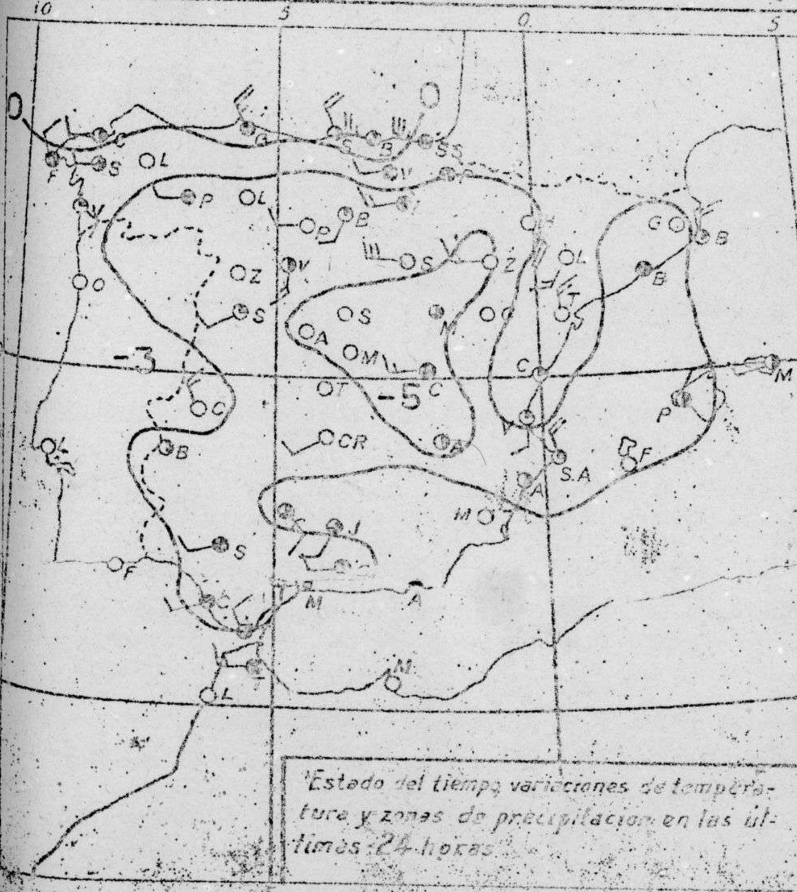
Estado del tiempo, variaciones de temperatura y zonas de precipitación en las últimas 24 horas.