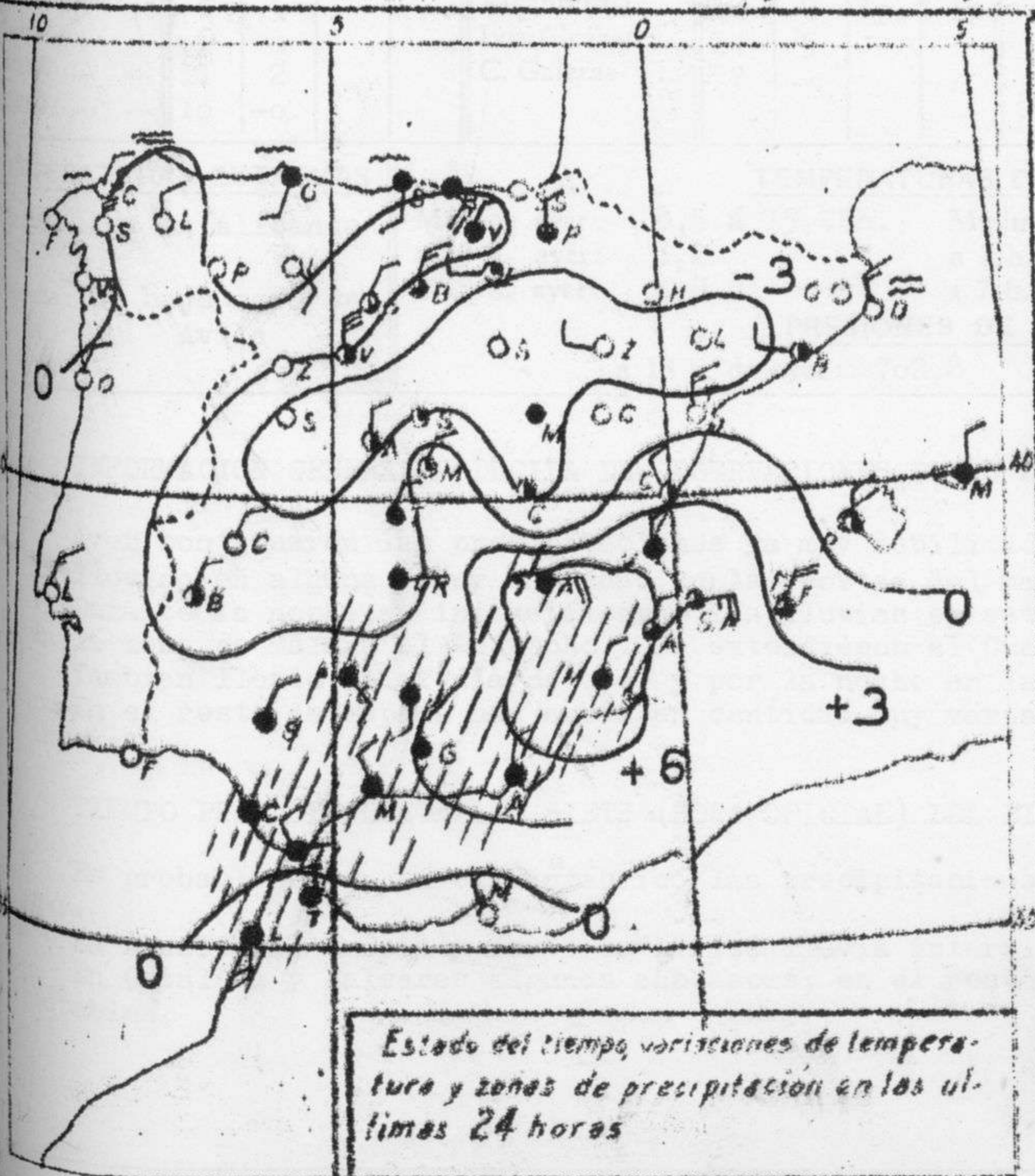
Estado del tiempo, variaciones de temperatura y zonas de precipitacion en las ultimas 24 horas