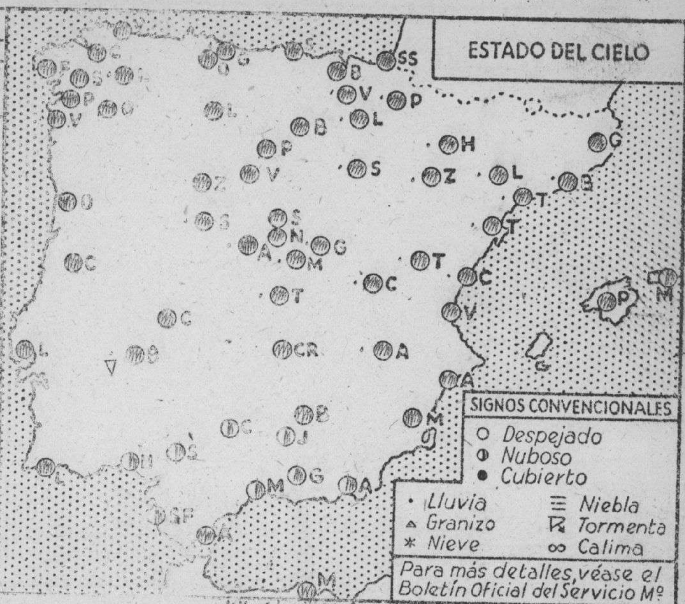
ESTADO DEL CIELO