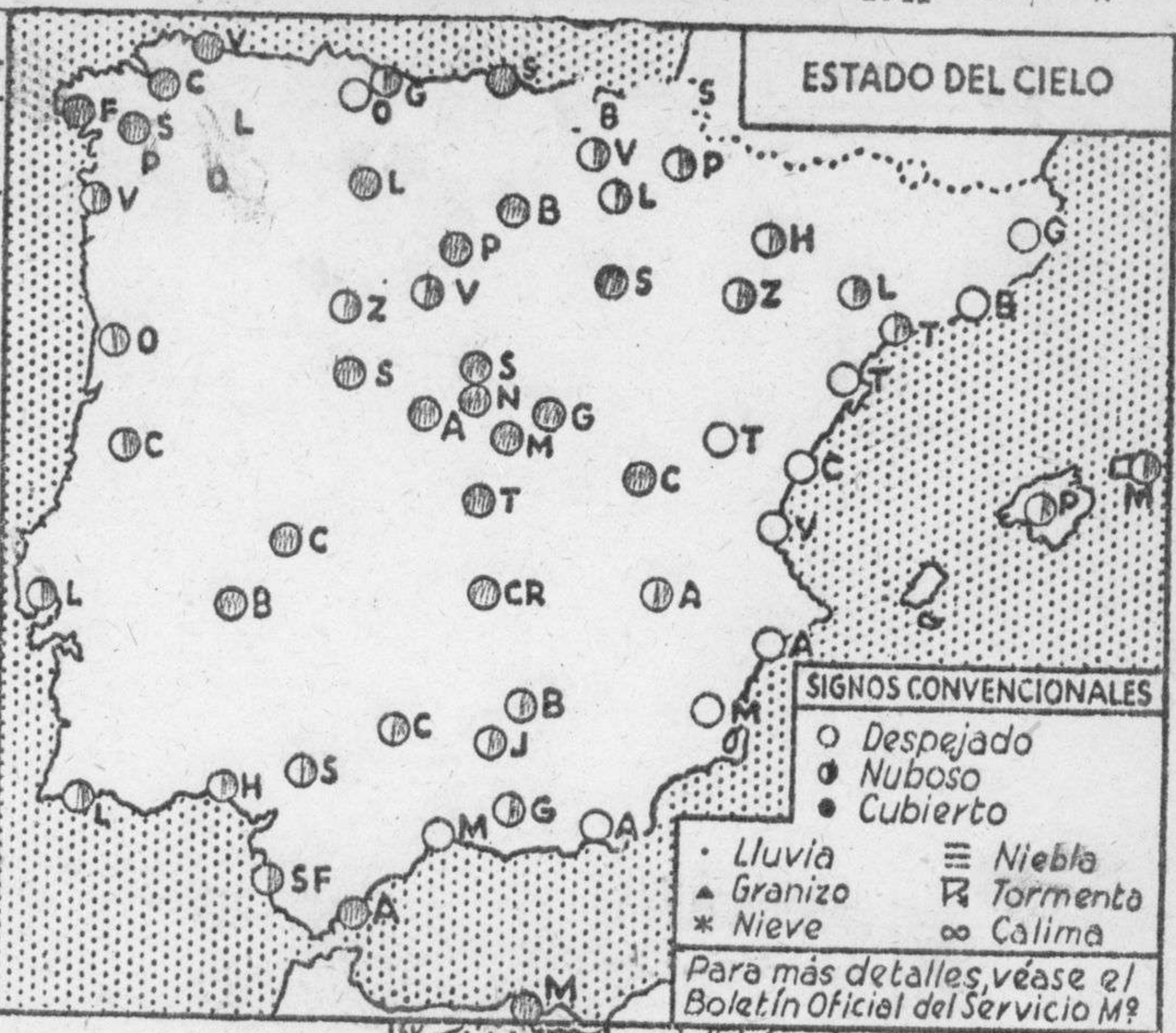
ESTADO DEL CIELO