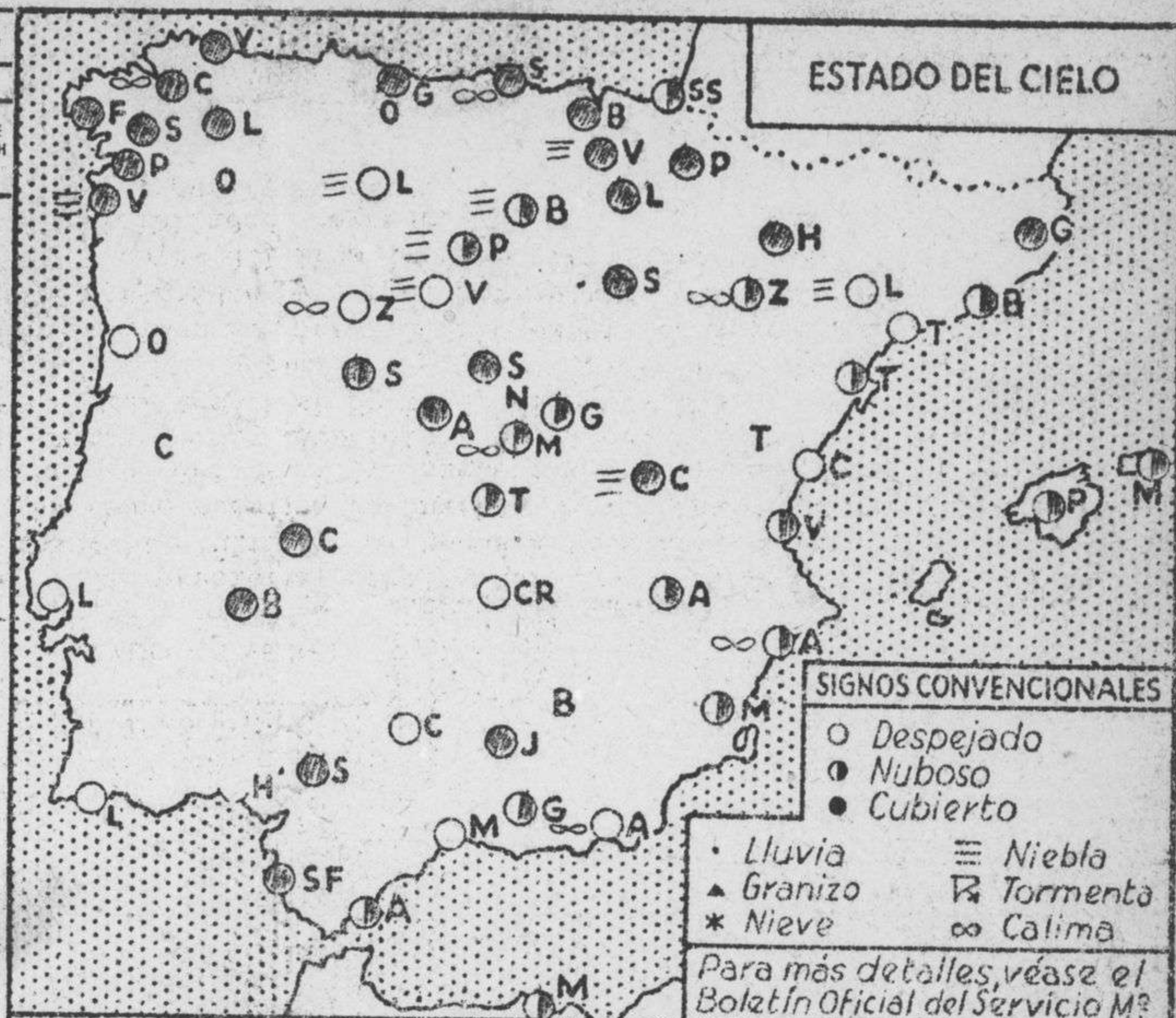
ESTADO DEL CIELO