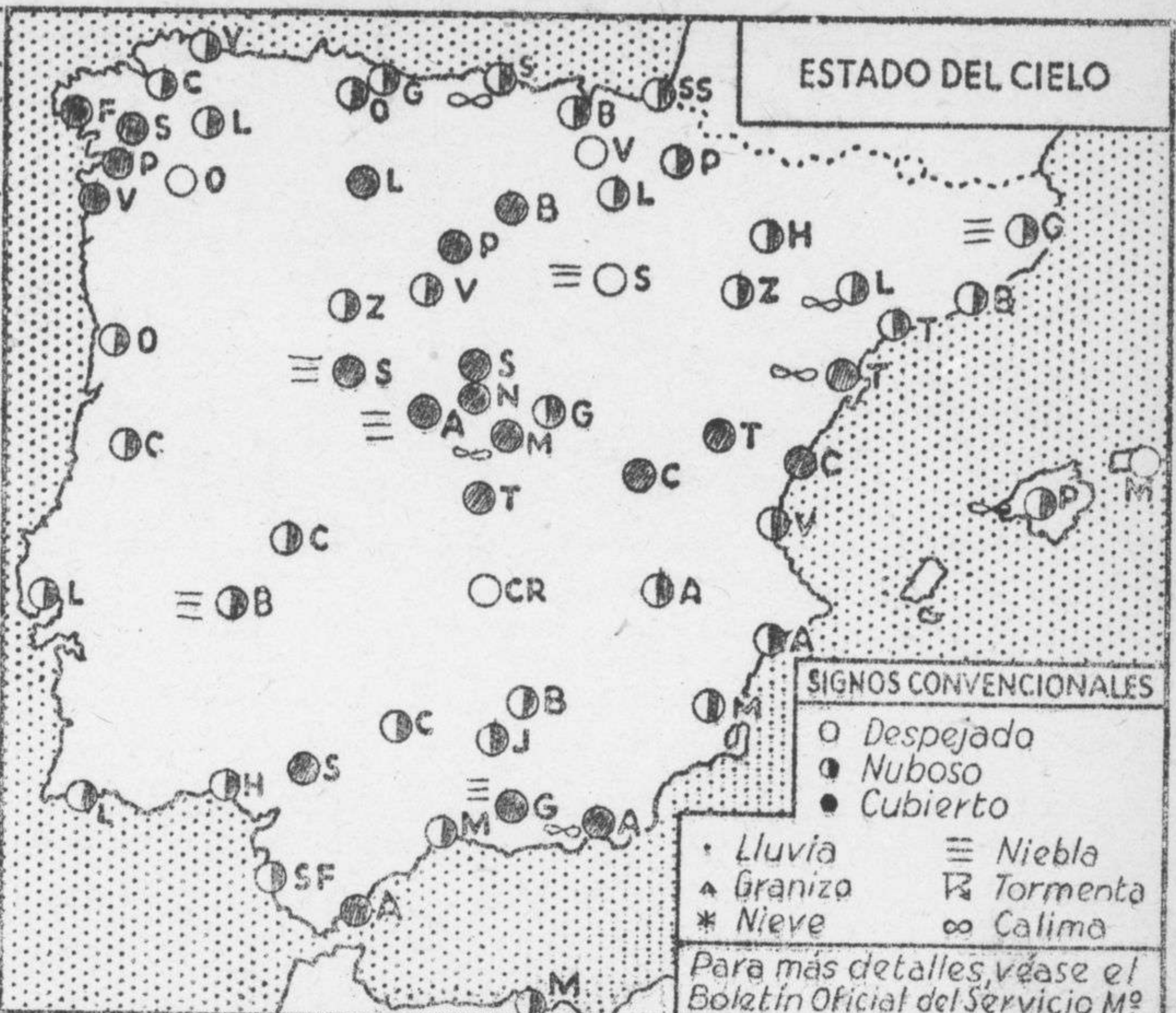
ESTADO DEL CIELO