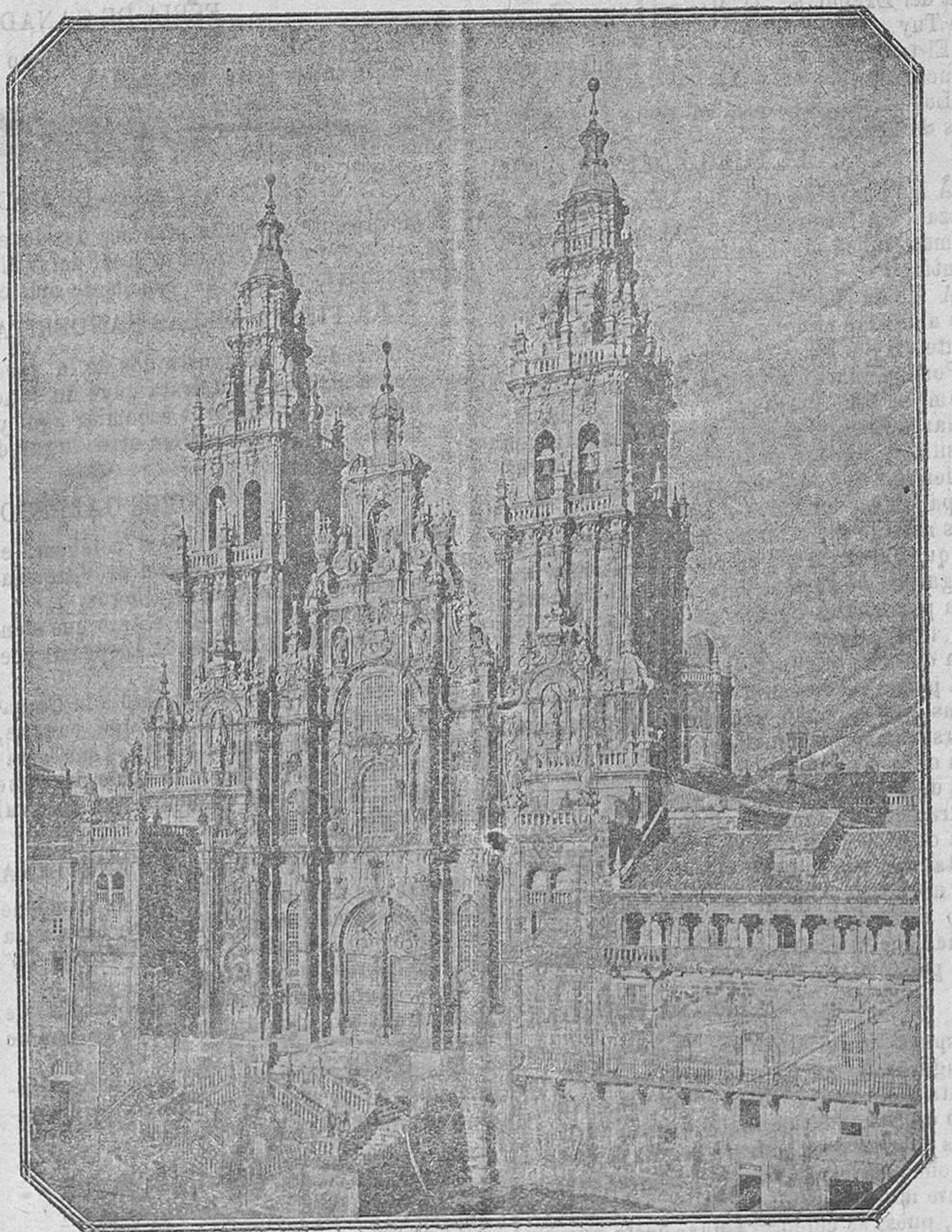
Catedral.—Fachada del Obradoiro