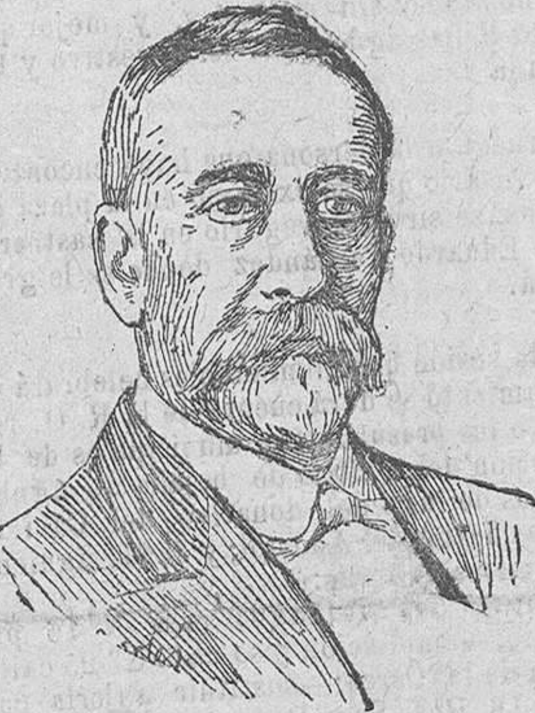
El príncipe de Monaco que ha fallecido en París recientemente