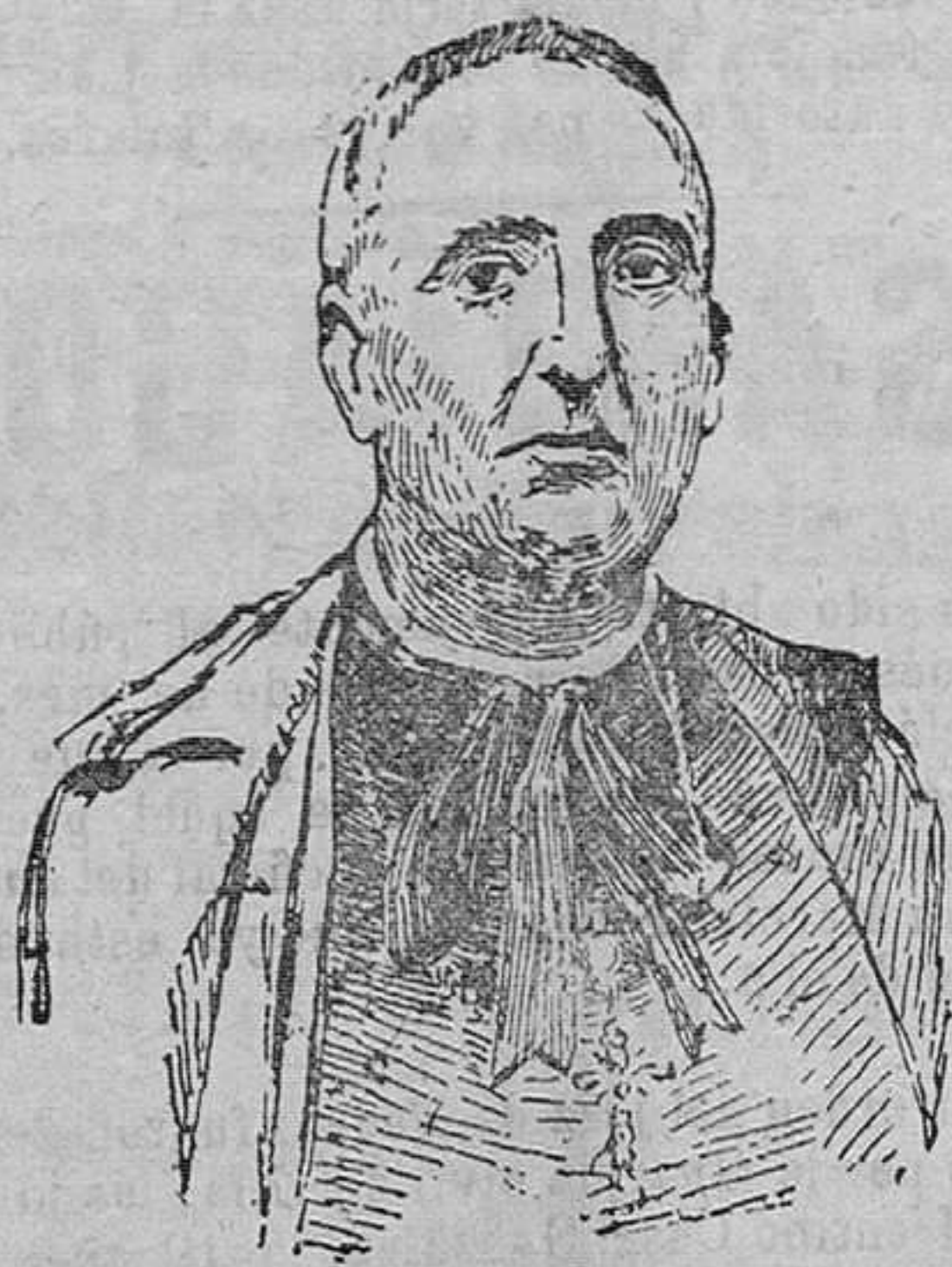
El Ilmo. Dr. D. Rigoberto Domenech obispo de Mallorca, que ha sido elevado a la silla arzobispal de Zaragoza

pondió ni al momento ni a la calidad de sus realizadores. Fué un motín de letras de imprenta, lanzadas al combate por la indignación, la ira y las ofuscaciones; el plomo destinado a exportar y esclarecer tuvo empleo agresivo, y las planas compuestas muchas veces con fervor artístico y propósitos nobles, solían quedar borradas por el tumulto. Aún no euajaba el periodismo efectivo, amplio, consistente, recio; aún parecía instrumento de disputa, olvidando con el acaloramiento que estaba dispuesto para el estudio de grandes problemas.