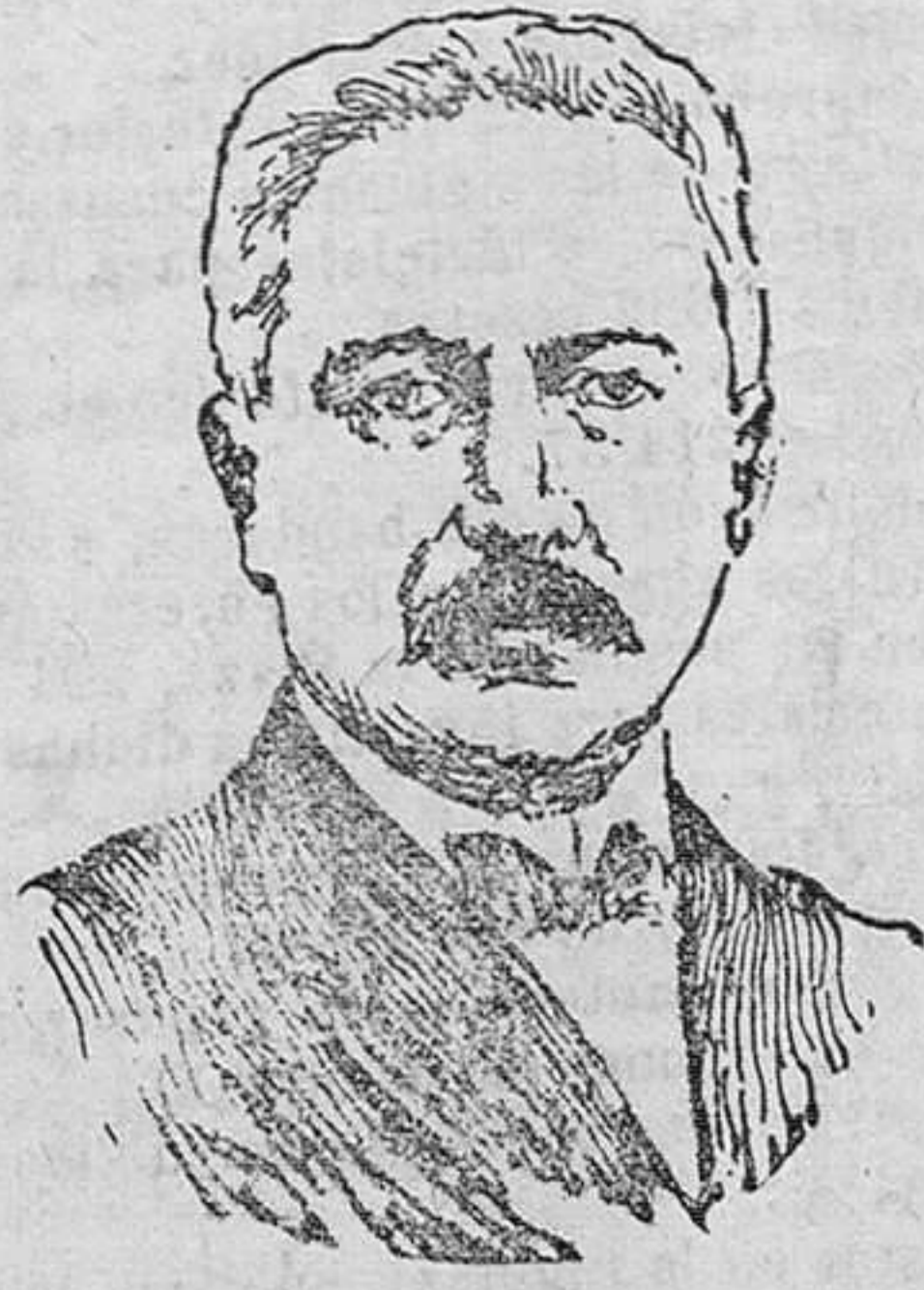
Victor Emanuele Orlando, ex presidente del Consejo de ministros italiano que se encuentra en Madrid y visitará Toledo, Segovia Escorial, y otras poblaciones españolas