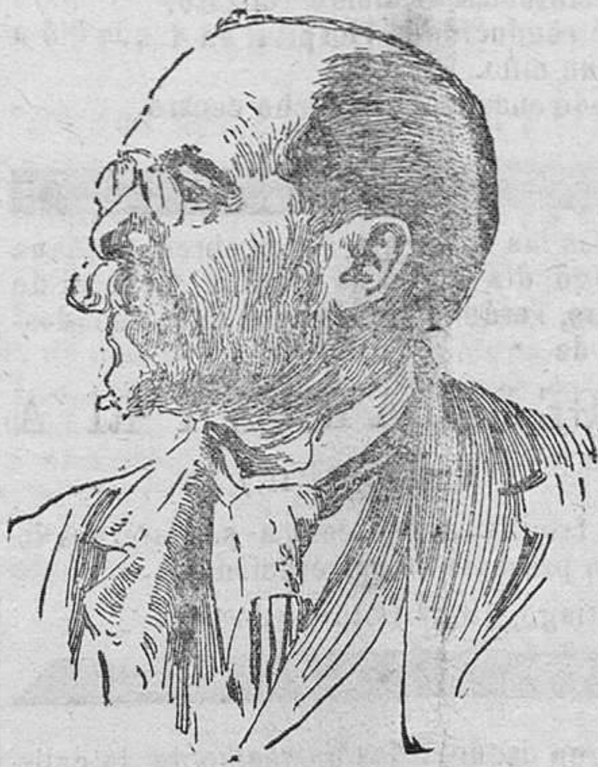
El laureado pintor Don Antonio Mu- ñoz Degraín, que ha fallecido en Má- laga, dejando un hueco muy difícil de llenar en el arte.

empeño suspiran. Y he aquí a los des- ejércitos frente a frente, con las es- padas en alto. De un lado populistas y nacionalistas; del otro socialistas y demócratas. Y el centro en su sitio en el medio procurando cumplir con su misión, la de mantener en equili- brio, para lo cual no tiene más reme- dio que inclinar el cuerpo algo hacia la izquierda. ¿Qué ocurrirá ahora? Poco habrá de vivir quien no lo vea. Profecías aparte; que en noticia pon- dría en ridículo a la propia pitonisa de Delfos, las soluciones que más probables parecen siempre que los populistas mantengan su amenaza, son estas dos: o se lleva a cabo la coalición que proyecta Marx y que no tardaría en acabar como el rosa- rio de la aurora, o se disuelve el Reichstag y se va a unas elecciones nuevas. Perspectiva esta última en la que todos se las prometen ser muy felices, pero que en el fondo, por razones de muy diversa índole—ne en último lugar la falta de dinero—no seduce a nadie.