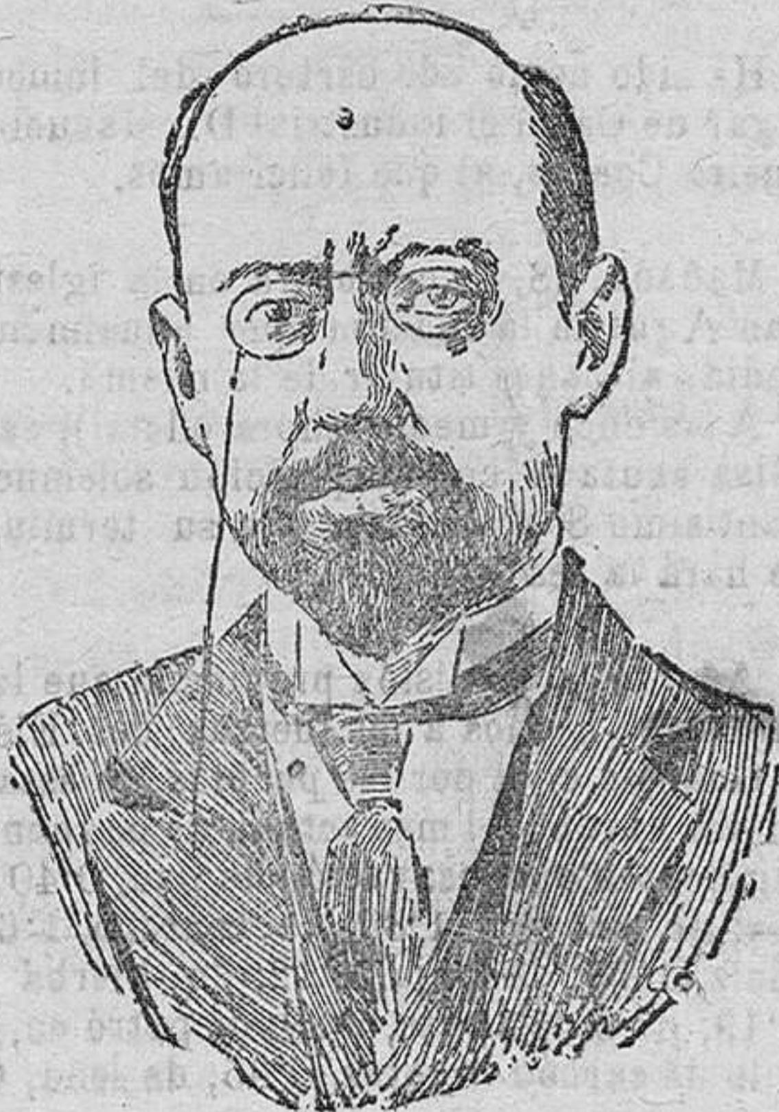
El exministro belga señor Vanderbelde que ha salido de Bélgica para Viena y los Balcanes; invitado por los Socialistas de Bulgaria y Yugoslavia.