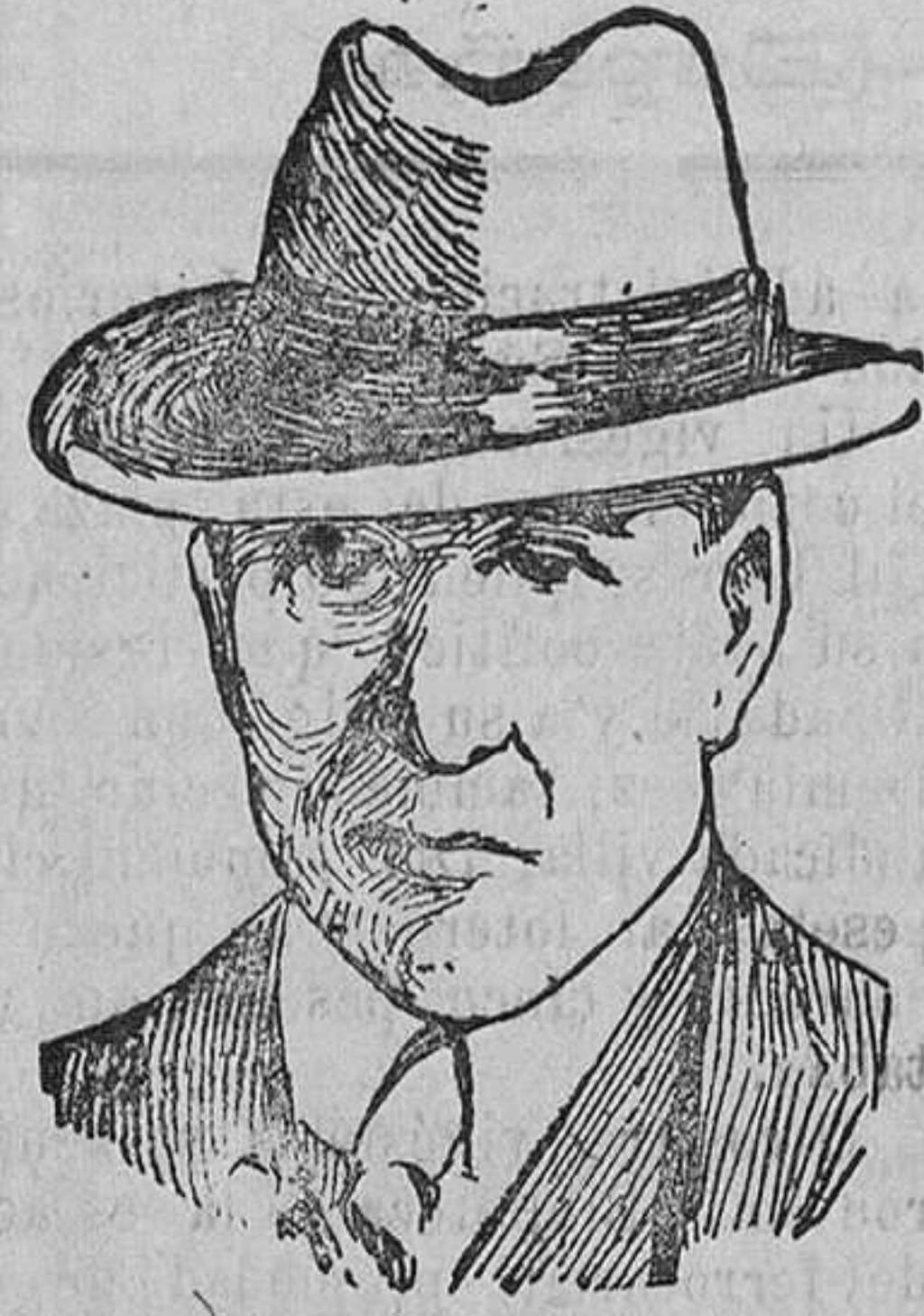
Charles Dawes Gates vicepresidente norteamericano al que se le ha atorgado el Premio Nobel de la Paz de 1926.