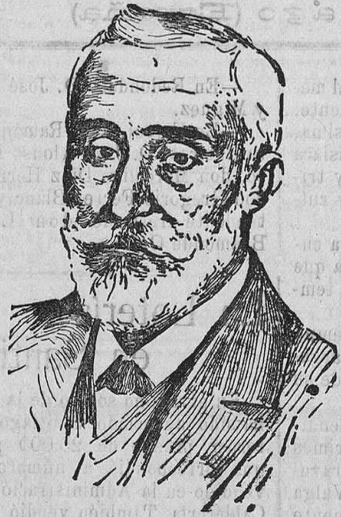
D. Antonio Maura y Montaner, cuyo primer aniversario de su fallecimiento se celebra hoy

«Muy reconocido cariñosa felicitación, más grata por proceder de vuestros ilustres. Ofrezco en mi cargo a esa ilustre Corporación.—Menéndez Pidal.»