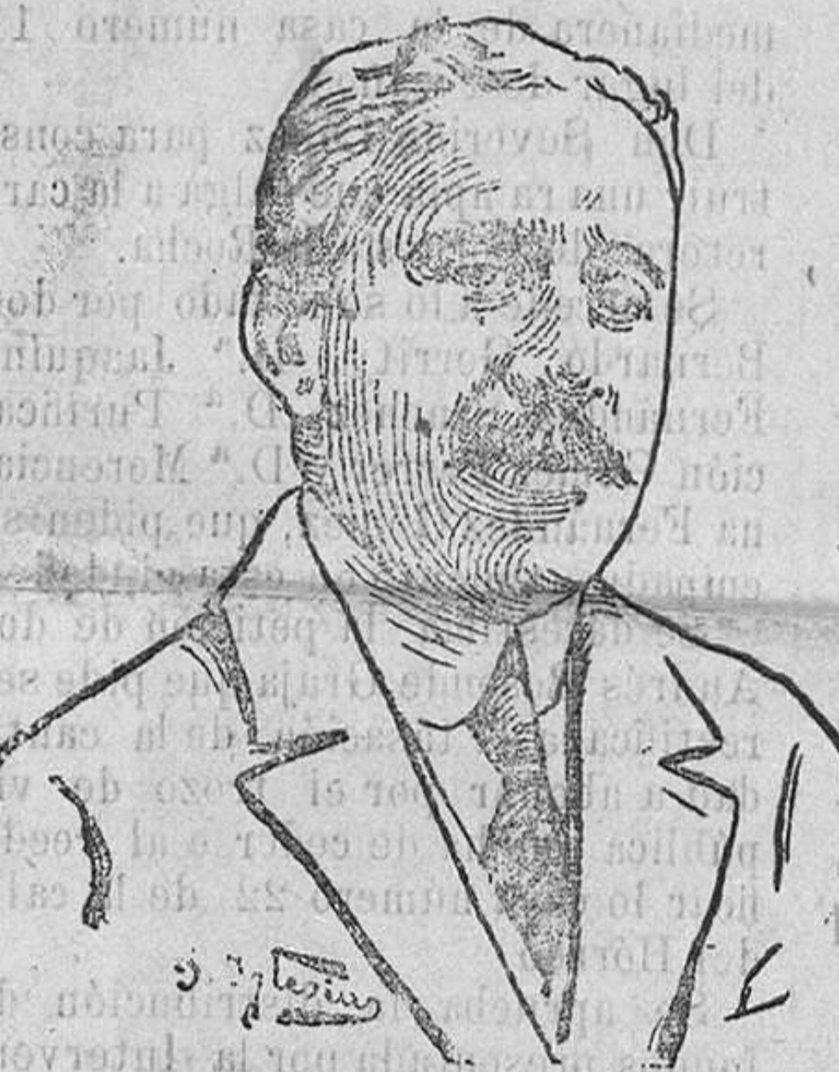
El ex ministro conservador don Fernando Sartorius, conde de San Luis que ha fallecido en Zarauz donde veraneaba.