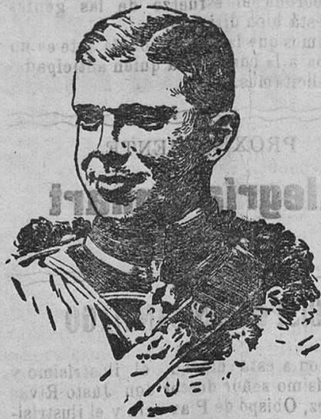
S. A. R. el Infante D. Fernando, que fué encargado por el Rey de presentar la ofrenda al Apóstol en sustitución de S. A. R. el Príncipe de Asturias que se halla indispuerto.