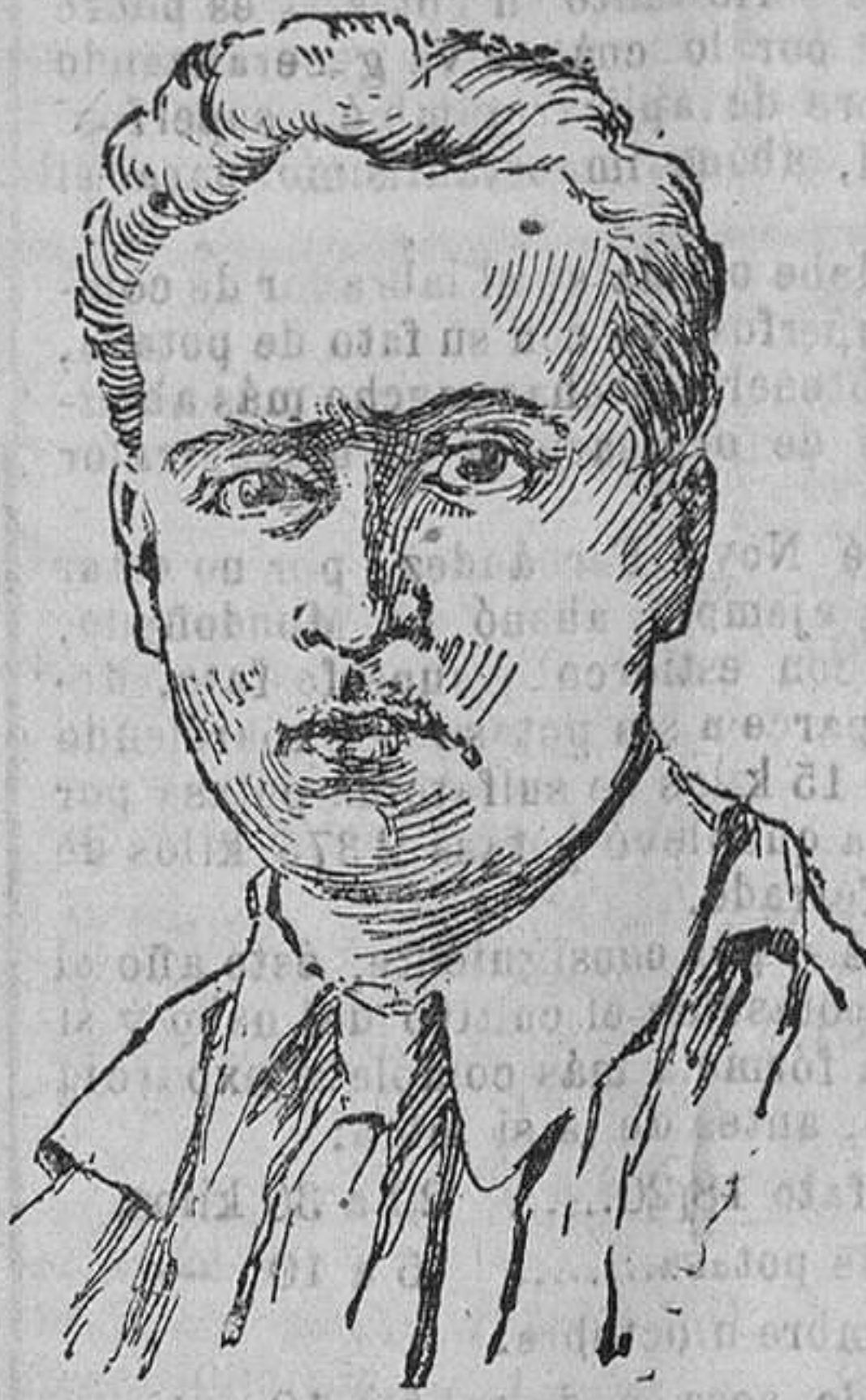
El distinguido pintor paisajista Daniel Vázquez Díaz.

carteado que se llamaba «el burro». Aquella tarde, al llegar al teatro Lirón y preguntarle un compañero de donde venía, respondió: