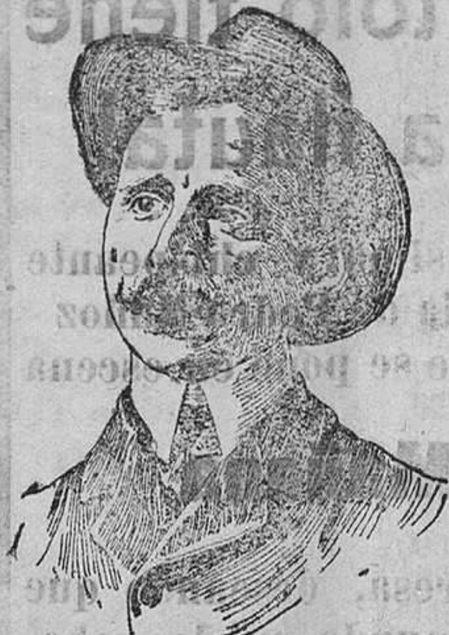
El famoso arquitecto D. Antonio Palacios que acaba de ingresar en la Academia de Bellas Artes

Somos —añade— hombres formales que trabajamos por un mismo ideal sano y grande.