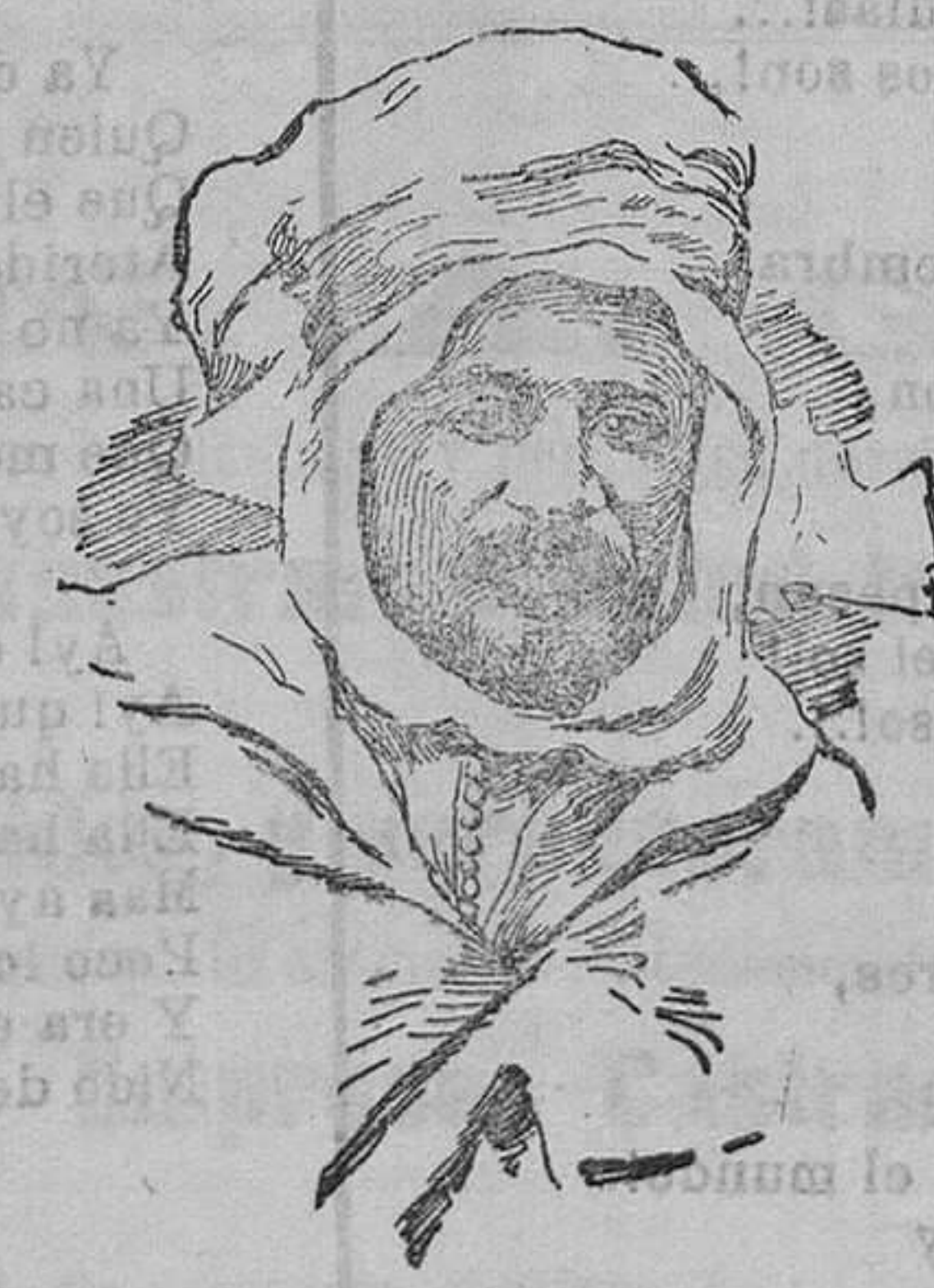
Muley Issut, Sultán de Marruecos ante el cual hará acto de sumisión Abd-el-Krim.

Entre los objetos hallados en los últimos refugios que tuvo el cabeçilla, han aparecido varias cajas de licores que saboreaba Abd-el-Krim, en sus