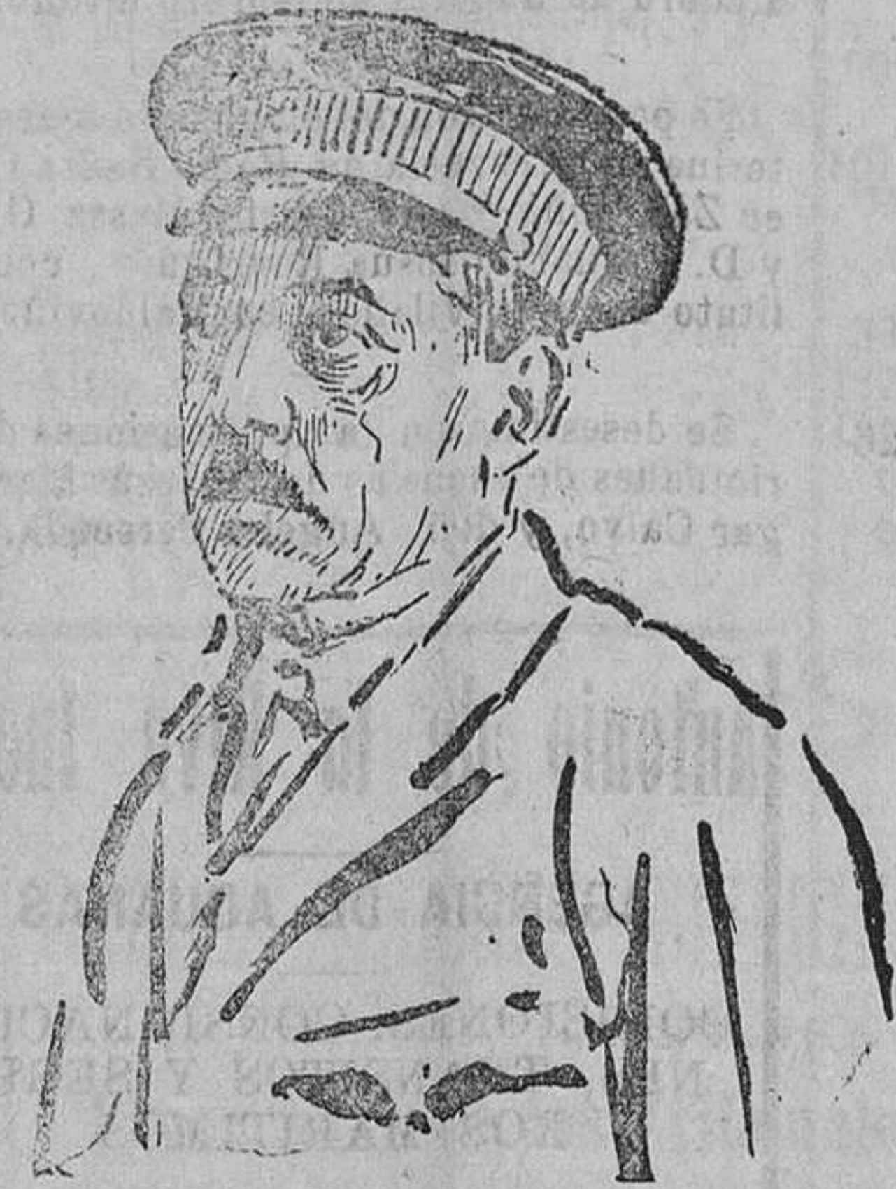
El alto comisario en Marruecos, general D. José Sanjurjo, nombrado ahora marqués de Monte Malmus.