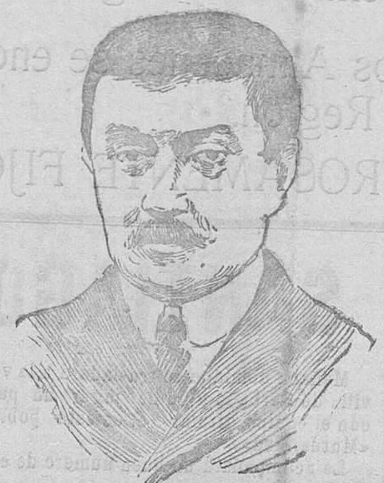
Mr. Painlecé jefe del Gobierno francés a quien le fué ratificada la confianza por el Presidente de la República y que formó el nuevo ministerio.

to ilustre, si estamos reducidos al aligustre?