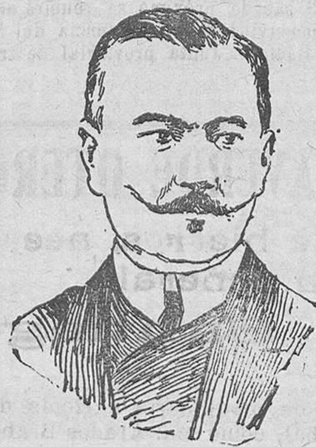
Ahmed Fuad I rey de Egipto, que ha sido nombrado miembro honorario de la Sociedad Geográfica Española.

obtenido en ellas un completo éxito pues se dispuso ahora, conforme a lo pedido, que se rebaje el nivel de la carretera en el kilómetro 52 y en una extensión de 120 metros con lo cual podrá acometerse aquella obra.