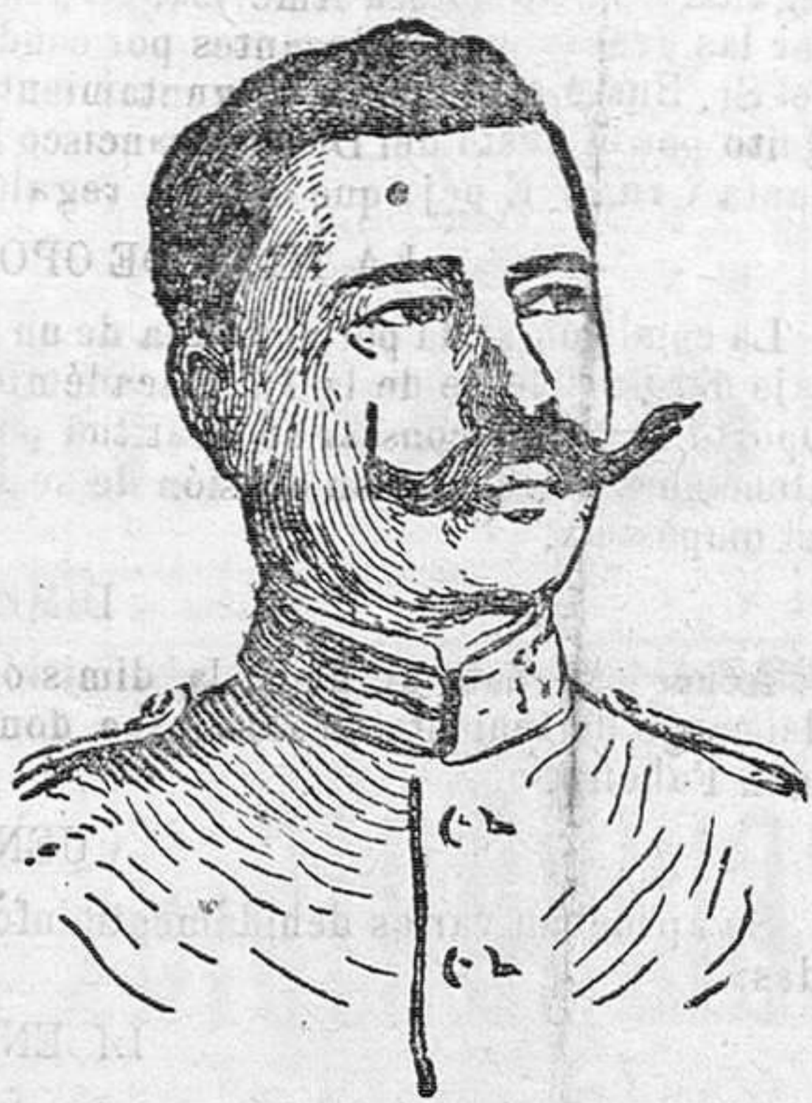
El general Fernandez Silvestre, heroico soldado que perdió su vida en Annual volviendo su figura a ser de actualidad con motivo del proceso a los generales Berenuger y Navarro