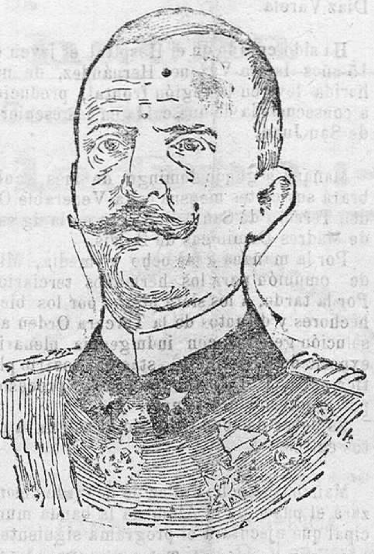
El rey Victor Mannel III