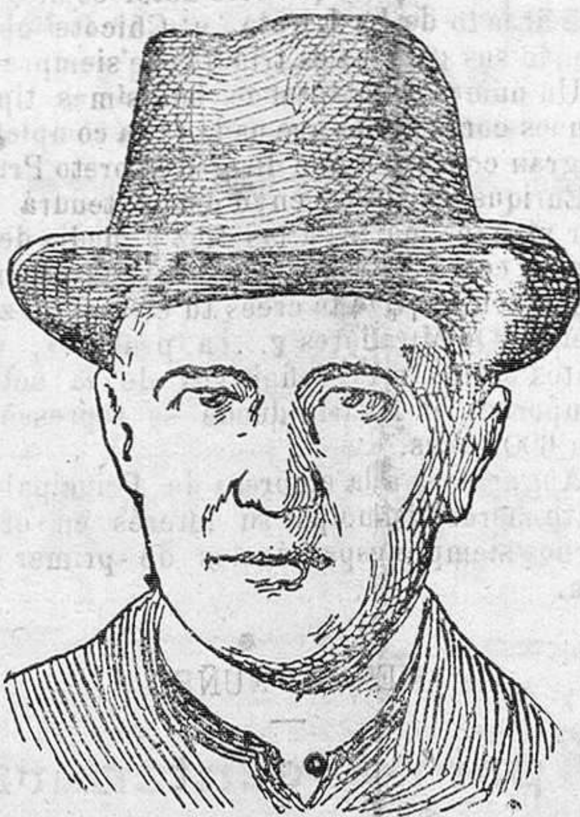
Monseñor Hayes, arzobispo de Nueva York, que ha sido elevado a la dignidad de Cardenal en el último consistorio

desvirtuar con un sólo gesto mis predicaciones de tantos años.