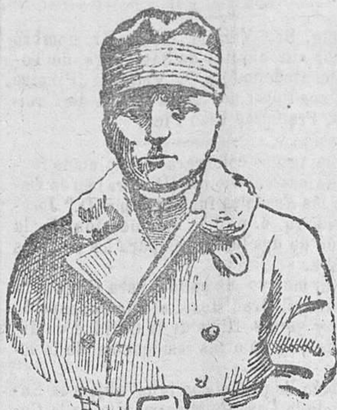
El célebre poeta italiano Gabriel D'Anuncio, que se propone hacer en aeroplano la travesía de Roma a Buenos Aires.

un hombre de unos 30 años, alto y de elegante porte con el que simpaticó desde el primer momento. Su tez blanca y ligeramente sonrosada, su despejada frente y sus castaños y algo saltones ojos, revelaban la dulzura de su carácter. Mientras su mecánico y mis acompañantes disponíanse a reparar la avería nosotros charlamos; diplomática y cortés charla al principio, sin animación, sin calor, de las ruedas y sus llantas, de mecánicos y motores, de las carreteras tan descuidadas de la Mancha... Ah! ¡si al menos fuesen como las de mi tierra! hube de exclamar yo.