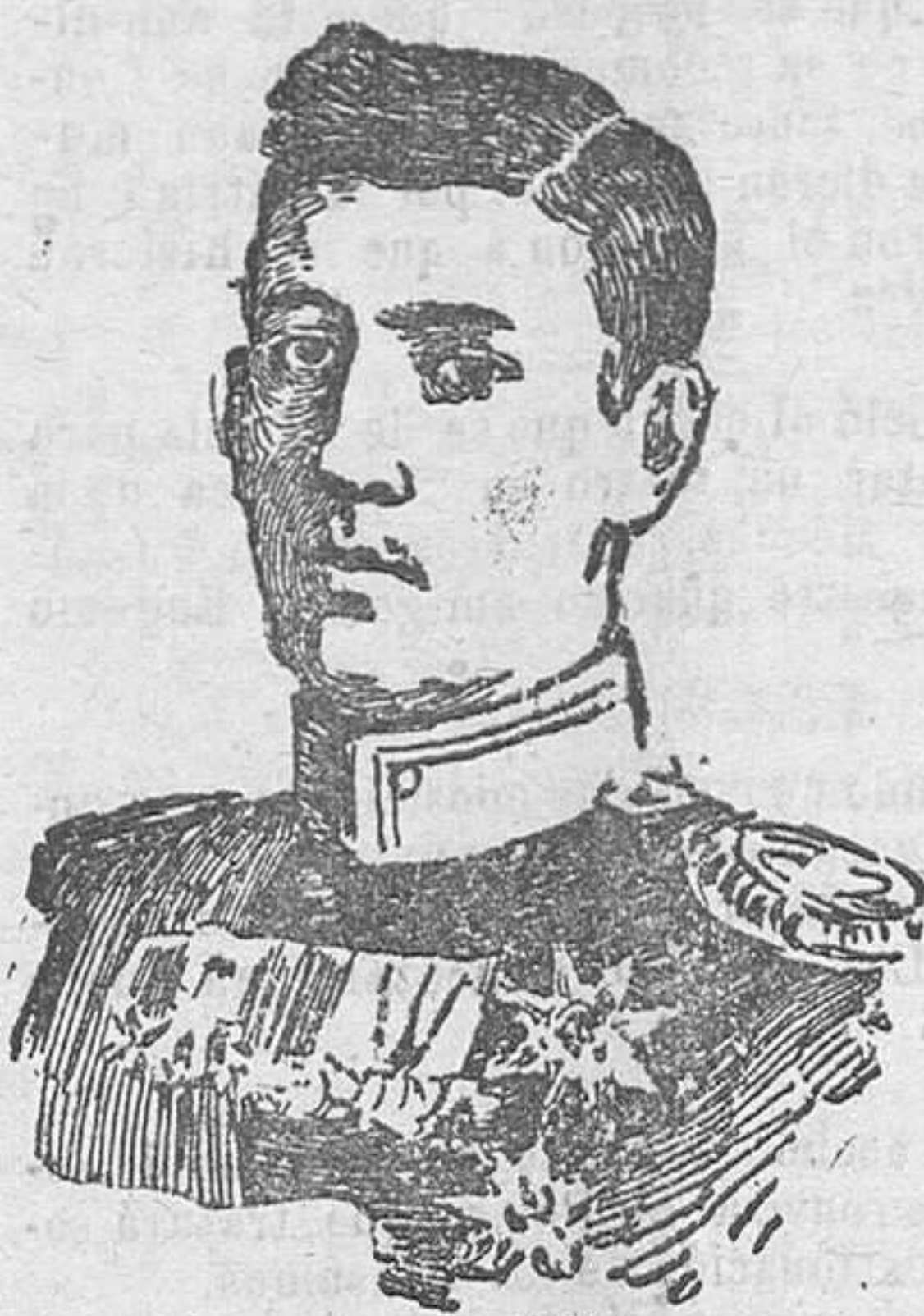
El rey Boris de Bulgaria, que en las cercanías de Sofía ha sido tiroteado por los agrario-comunistas, muriendo en la refriega dos de sus acompañantes.