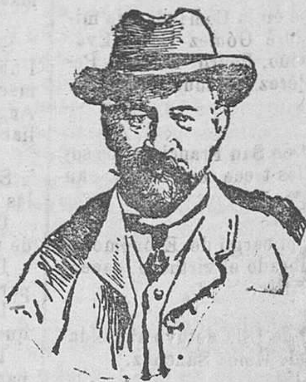
El príncipe Livoff, presidente que fué del Consejo del Gobierno provisional ruso, que ha fallecido repentinamente en Boulogne Sur-Seine.

—A las nueve menos quince. —¡Siempre están variando el horario de los trenes!