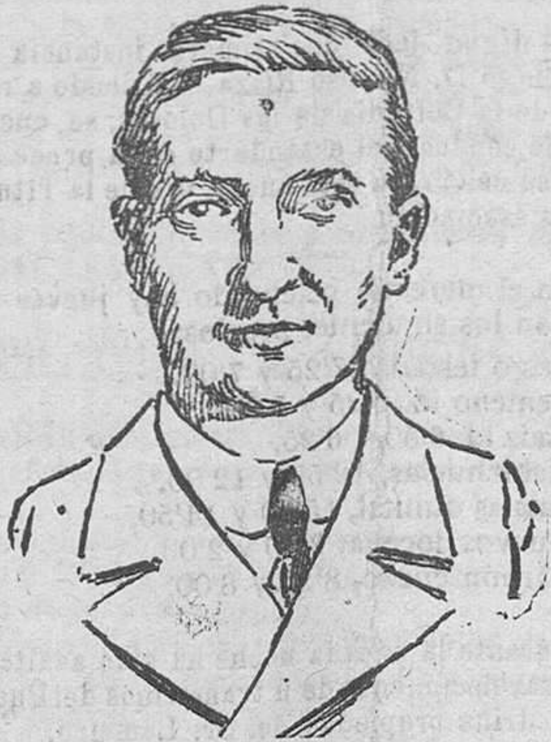
El gobernador regente de Hungría, almirante Horthy, contra el cual se formularon acusaciones en las memorias del ex emperador Carlos publicadas en aquel país.